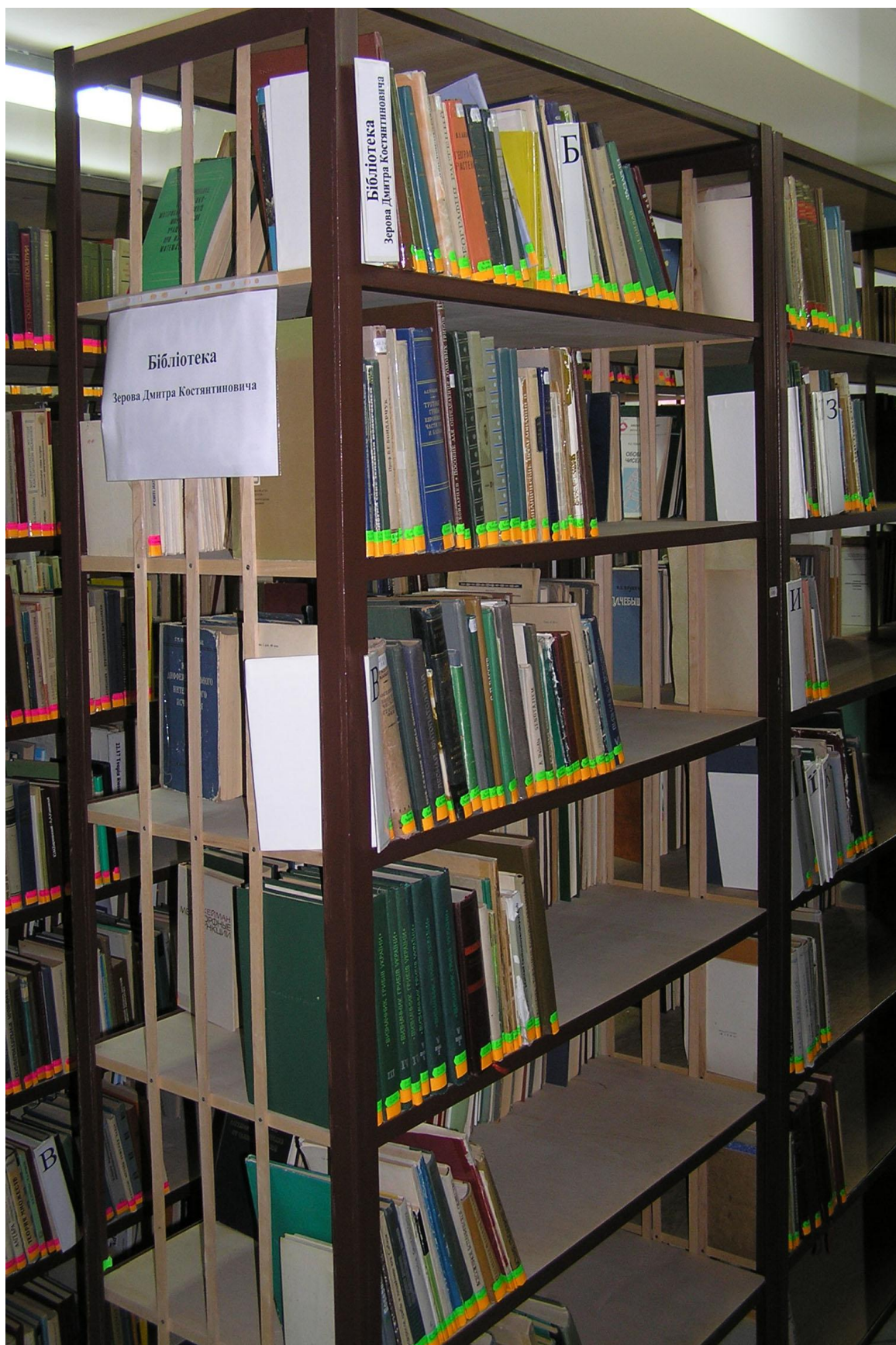
Видання з бібліотеки академіка Д. К. Зерова у фонді бібліотеки природничої літератури ВНУ ім. Лесі Українки