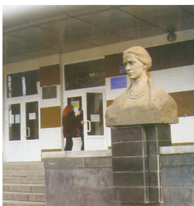
Луцьк, ВНУ ім...Лесі Українки. Погруддя Лесі Українки