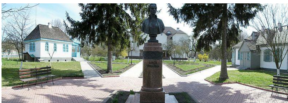
Колодяжне. Літературно-меморіальний музей-садиба Лесі Українки