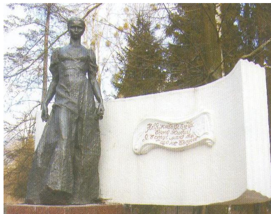
Луцьк. Пам'ятник Лесі Українки