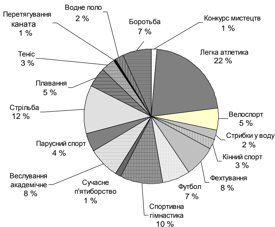
Рис. 1. Співвідношення учасників змагальних дисциплін, що проводились у рамках Олімпійських ігор 1912 р.

При цьому (рис. 1) уже з ігор у Стокгольмі конкурси мистецтв за кількістю їхніх учасників можна вважати повноцінною складовою частиною олімпійської програми.