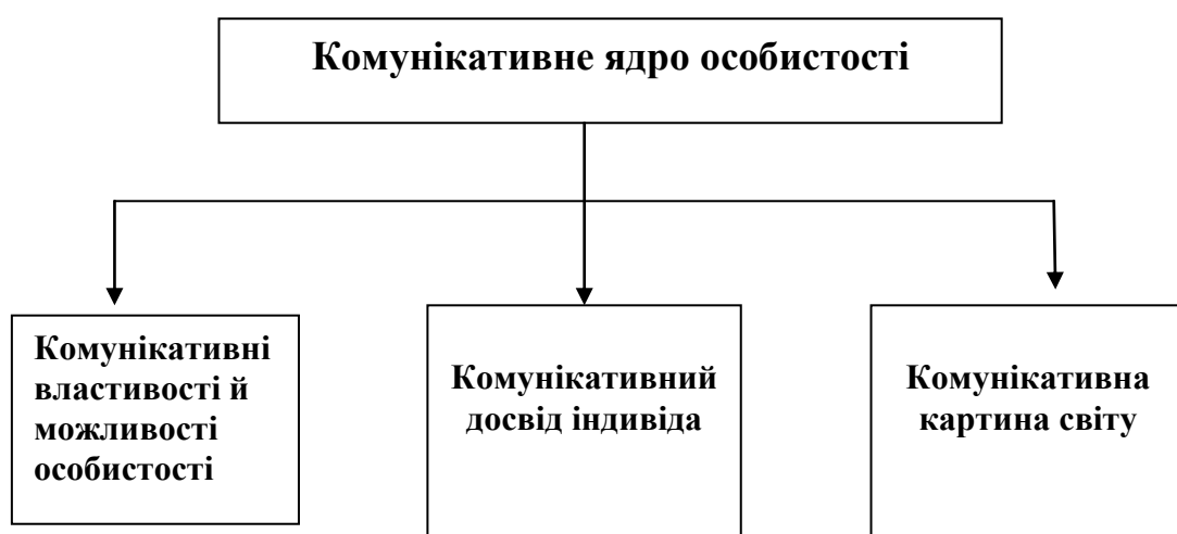
Рис. 2. Структура комунікативного потенціалу особистості

Л.Орбан-Лембрик описуючи структуру комунікативного потенціалу особистості пропонує розглядати її крізь призму комунікативного ядра. (рис.2.) [4, ст. 146].