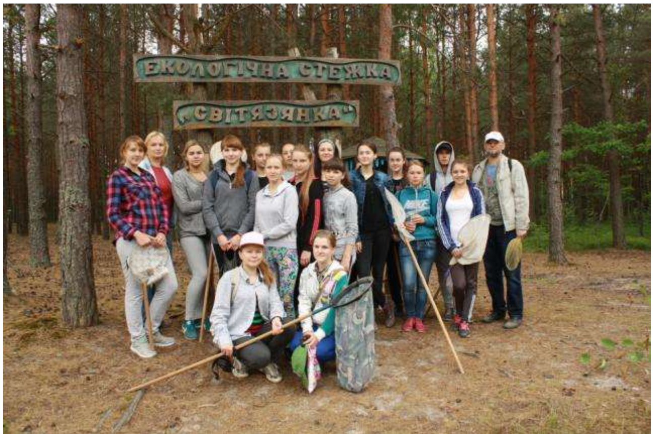
Польова практика 2015 р.