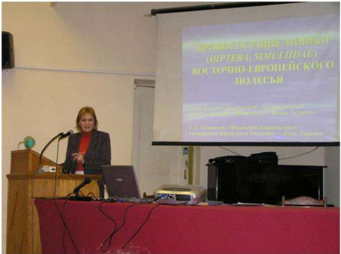
Доповідь на паразитологічній конференції Москва, 2008 р.