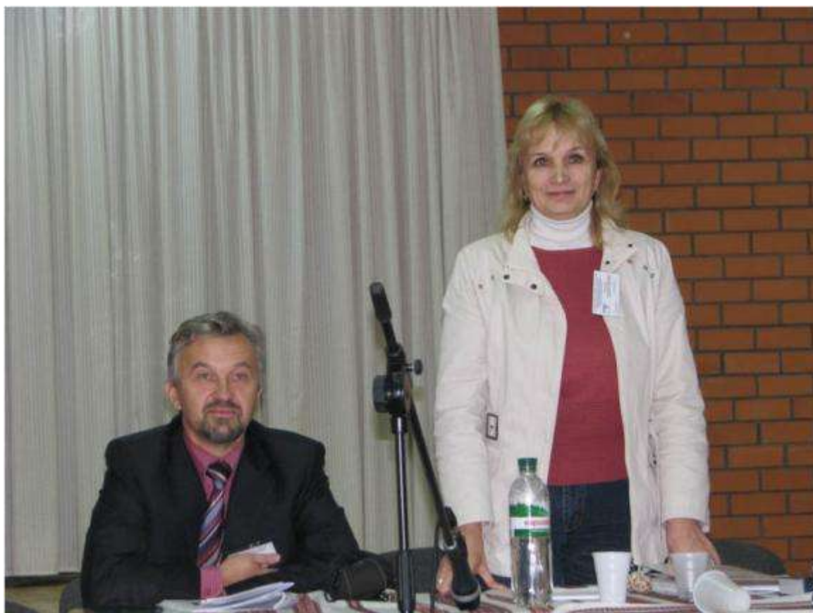
Конференція ШНПП 2012 р.