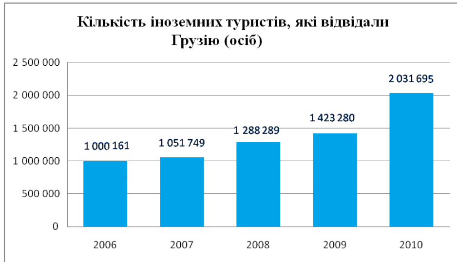
Рис. 1. Динаміка росту іноземних туристів у Грузії (2006–2010 рр.)

У контексті цього досить цікавим стало таке опитування. Для з'ясування враження від відвідування країни Департамент туризму і курортів Грузії 1–22 лютого і 4–15 травня 2010 р. в міжнародному аеропорту Тбілісі, на прикордонних пунктах у Садахло (на кордоні з Вірменією), Цітелі Хіді (на кордоні з Азербайджаном) і Сарпі (на кордоні з Туреччиною) провів опитування серед туристів, які залишають країну. У ньому взяло участь 1730 осіб, більшість із яких виявилися громадянами Німеччини, США, Великобританії й Франції. У результаті аналізу опитувань з'ясувалося, що 34 % опитаних приїхали до Грузії з діловою метою, близько 24 % відвідували своїх друзів і родичів, у 24 % приїзд був пов'язаний із відпочинком і розвагами, 8 % приїжджали за покупками, 4 % були транзитом. 30 % іноземних візитерів мали вік 35–44 років, 29 % – 25–34 роки, 21 % – 45–54 роки, по 9 % – 16–24 і 55–64 років, 2 % – понад 65 років. 81 % усіх, хто відвідав Грузію, були чоловіки. 46 % зупинялися в готелях та інших платних помешканнях великого обсягу, 37 % – у друзів або знайомих (безкоштовне житло). Середній час перебування в країні – 11,37 днів, у тому числі на відпочинок і розваги – 8,97 днів, на відвідування друзів та родичів – 13,58, ділові візити – 11,30. 61 % візитерів перебували в Грузії менше п'яти днів, а 6 % – більше 30 днів. Загальні витрати туристів різнилися залежно від мети відвідування країни [4].