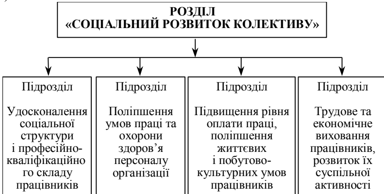
Рис. 1. Найважливіші напрями планування соціального розвитку колективу

З проблемою соціального розвитку персоналу пов'язані всі перелічені підрозділи розділу «Соціальний розвиток колективу» плану організації. Разом з тим найбільшу кількість заходів стосовно планування соціального розвитку персоналу містить саме напрям щодо вдосконалення соціальної структури трудового колективу і професійно-кваліфікаційного складу працівників.