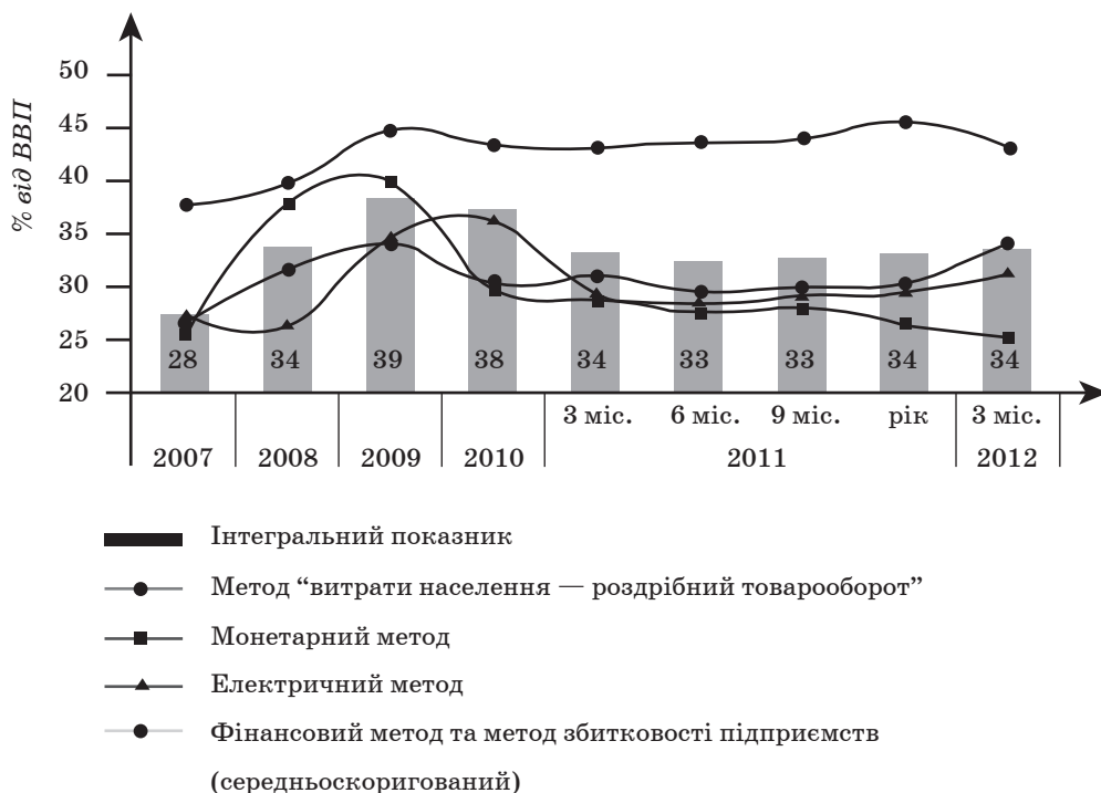
Рис. 1. Динаміка рівня тіньової економіки за різними методами, у % від обсягу ВВП

2010 р. відповідно. Однак у 2011 р. рівень перерозподілу ВВП через зведений бюджет перевищив позначку 30 % на 0,3 одиниці, що свідчить про можливі загрози економічній безпеці країни та прорахунки в бюджетній політиці.