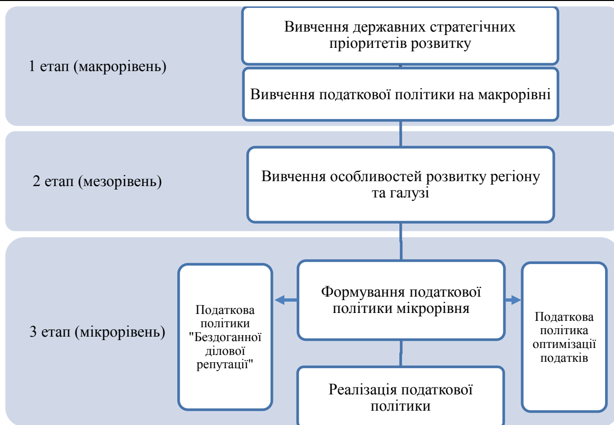
Рис. 1. Алгоритм формування та реалізації податкової політики підприємства

Нами був проведений узагальнюючий аналіз принципів податкової політики підприємства українських на зарубіжних авторів, проте, на нашу думку він є неповним і повинен бути доповнений наступними принципами: