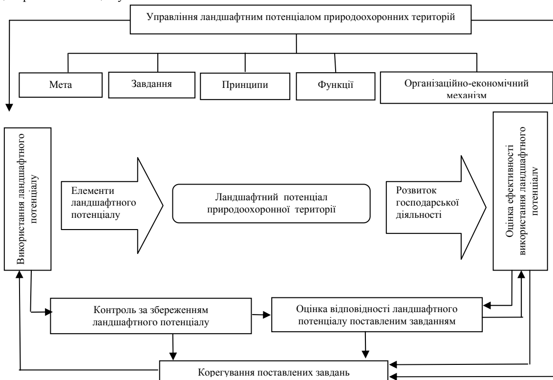
Рис. 1. Схема управління ландшафтним потенціалом природоохоронних територій

Економічна складова організаційно-економічного механізму управління ландшафтним потенціалом природоохоронних територій полягає не лише у методах, а і у цілях його функціонування. У економічній складовій закладено функції фінансового забезпечення, розвитку трудових ресурсів та нарощування інтелектуального потенціалу. Саме вона проводить контроль та здійснює оцінку ефективності використання ландшафтного потенціалу.