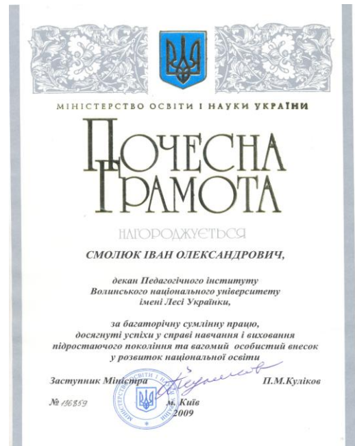
Почесна грамота Міністерства освіти і науки України