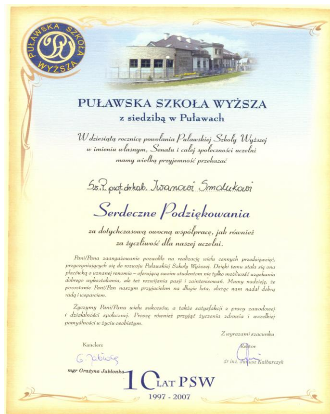
Подяка ректора Пулавської вищої школи (Республіка Польща) за співпрацю та участь у розвитку навчального закладу