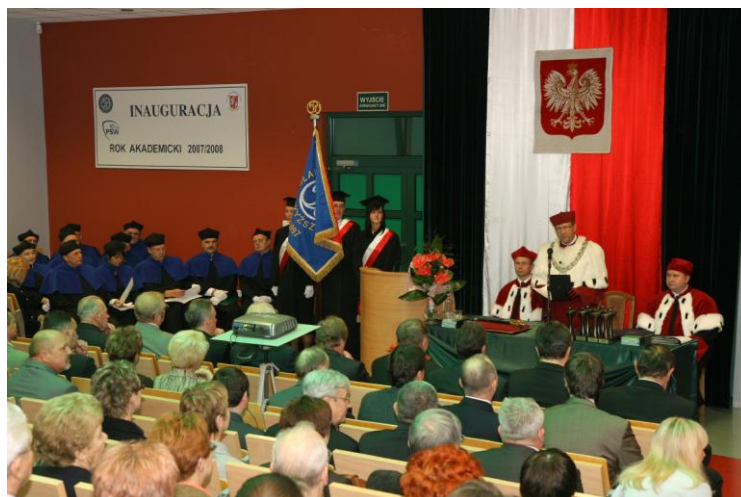
На інавгураційному відкритті нового навчального року (м. Пулави, Польща) (жовтень 2008 р.)