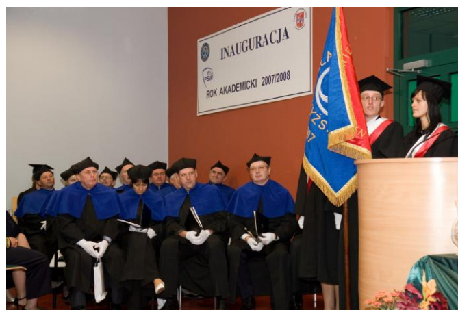
Серед членів Сенату Пулавської вищої школи (Республіка Польща) (2008 р.)