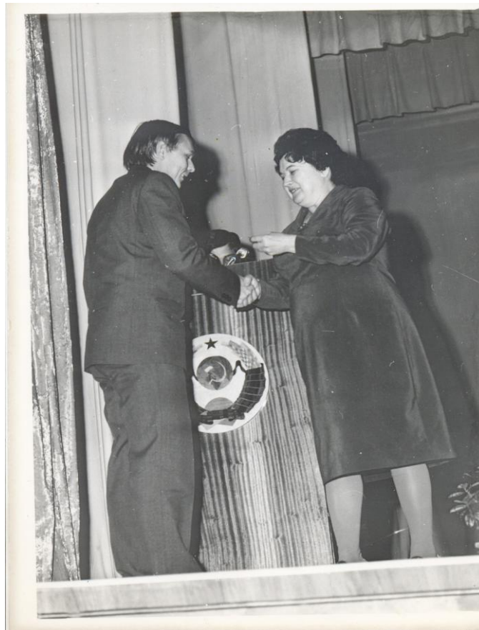
Підготовка до уроку у шкільній бібліотеці (1976 р.). Вручення нагрудного знаку "Старший учитель" (1979 р.)