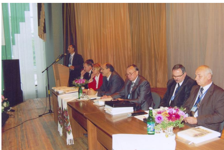
Міжнародна науково-практична конференція “Соціально-педагогічні аспекти сприяння здоров’ю учнівської та студентської молоді” (вересень 2010 р.)