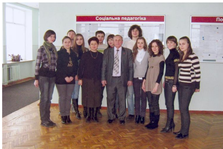
Студенти з Національного педагогічного університету імені М. П. Драгоманова у педагогічному інституті (березень 2009 р.)