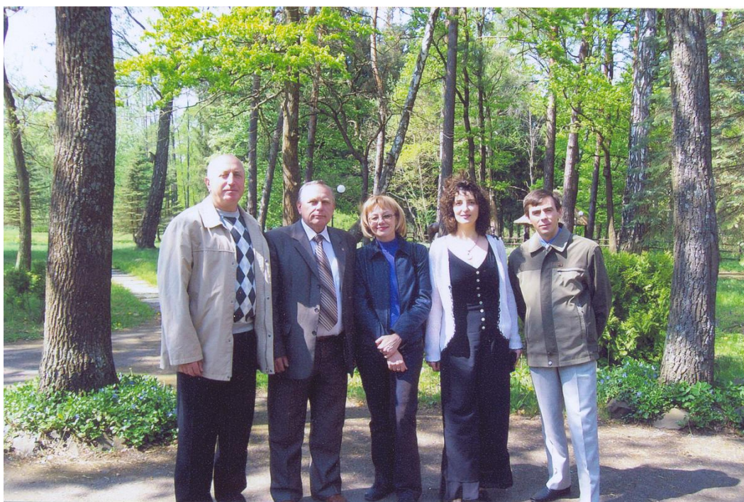
Учасники науково-практичної конференції “Професійна підготовка вчителів початкової школи у контексті інтеграції України до Європейського освітнього простору” (травень 2009 р.)