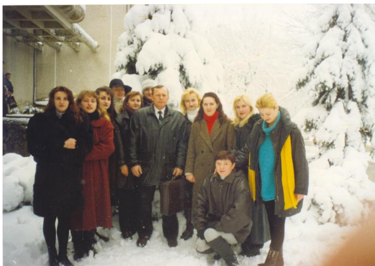
Зі студентами педагогічного факультету (квітень 1996 р.)