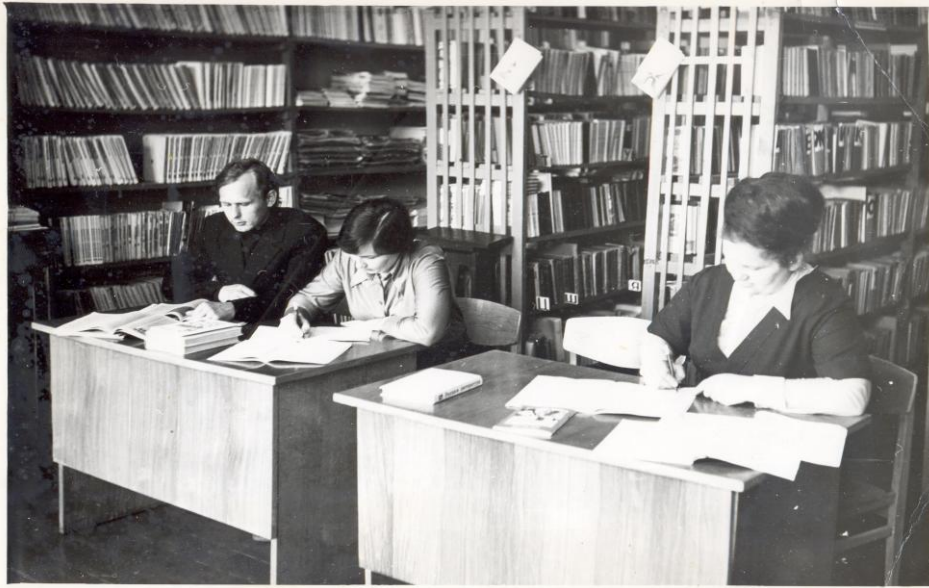
Підготовка до уроку у шкільній бібліотеці (1976 р.)