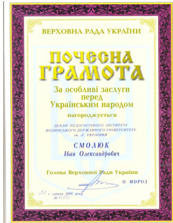
Поченна грамота Верховної Ради України