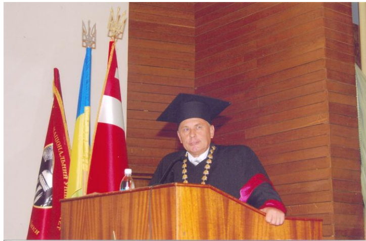
Виступ на спільному засіданні Вченої ради Волинського національного університету імені Лесі Українки та Президії Національної академії педагогічних наук України (10.06.2010 р.)