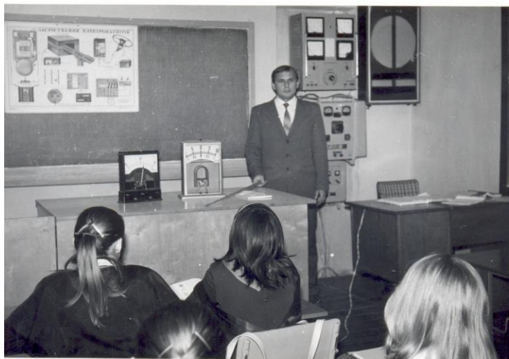
Урок фізики у Ковельській середній школі №4 (1979 р.)