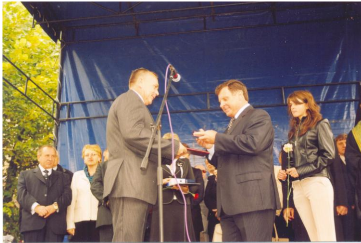
Перший заступник Голови Верховної Ради України А. Мартинюк вручає Почесну грамоту і нагрудний знак. (31.08. 2006 р.)