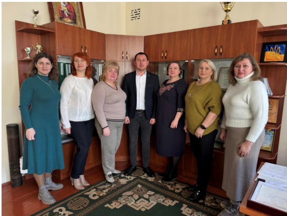
Розширюємо освітні горизонти