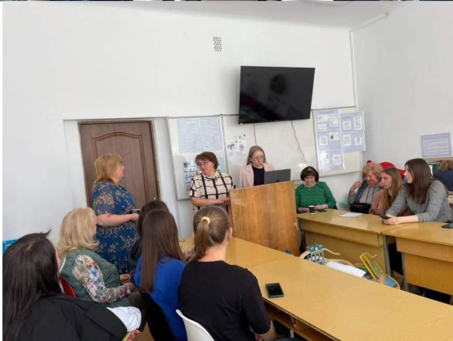
Зустріч зі стейкхолдерами (2024)