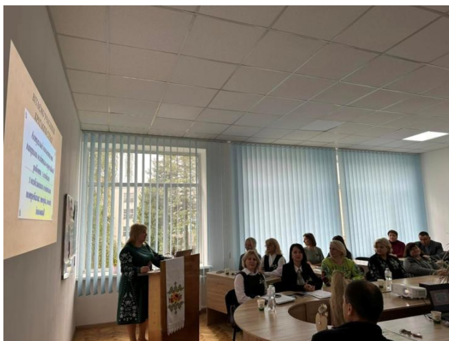
Круглий стіл (1 жовтня 2024 р)