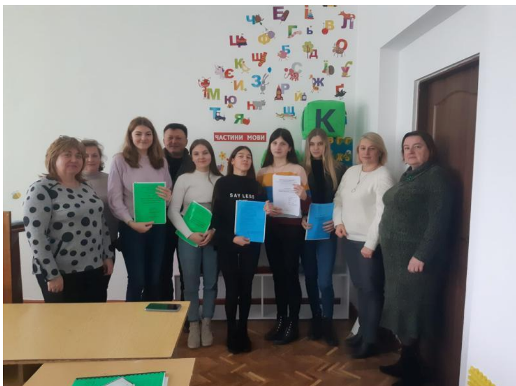
Захист курсових робіт