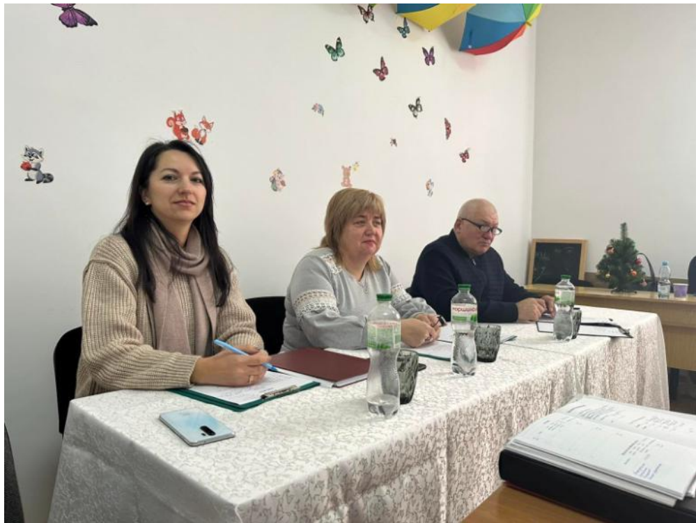
Робота в екзаменаційній комісії