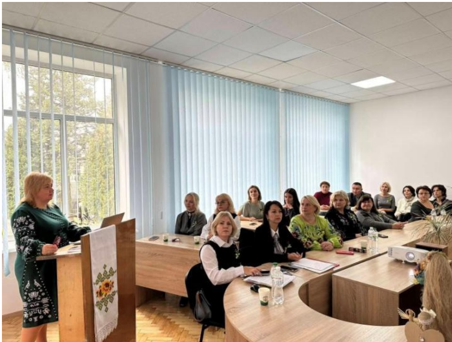
Вітання учасникам круглого столу