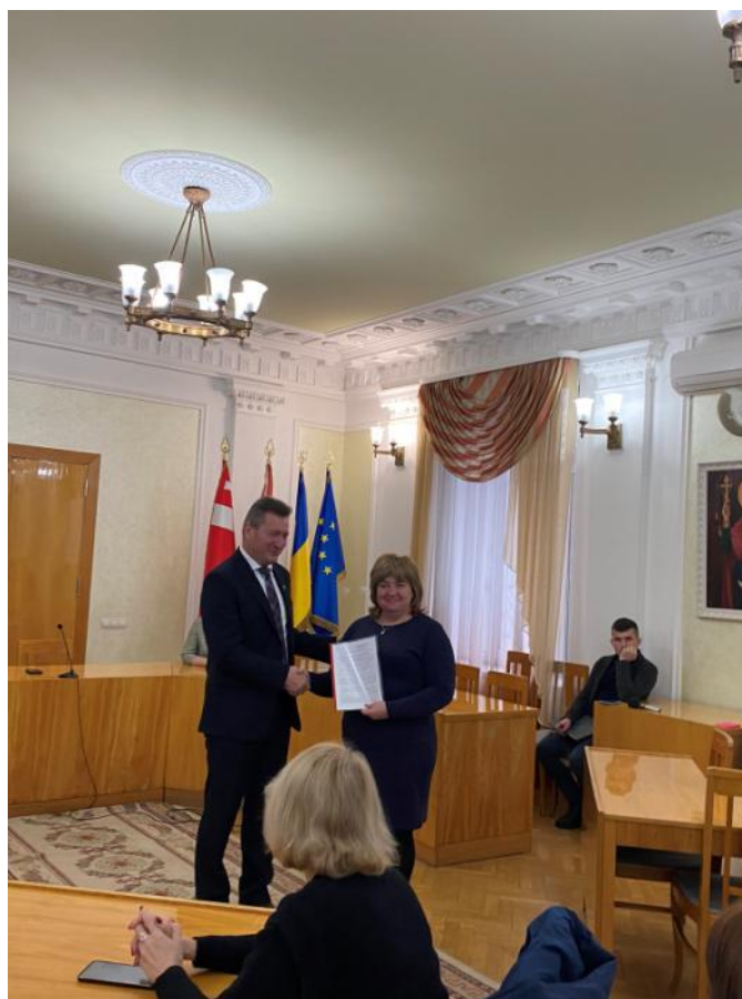
Вручення контракту завідувача кафедри