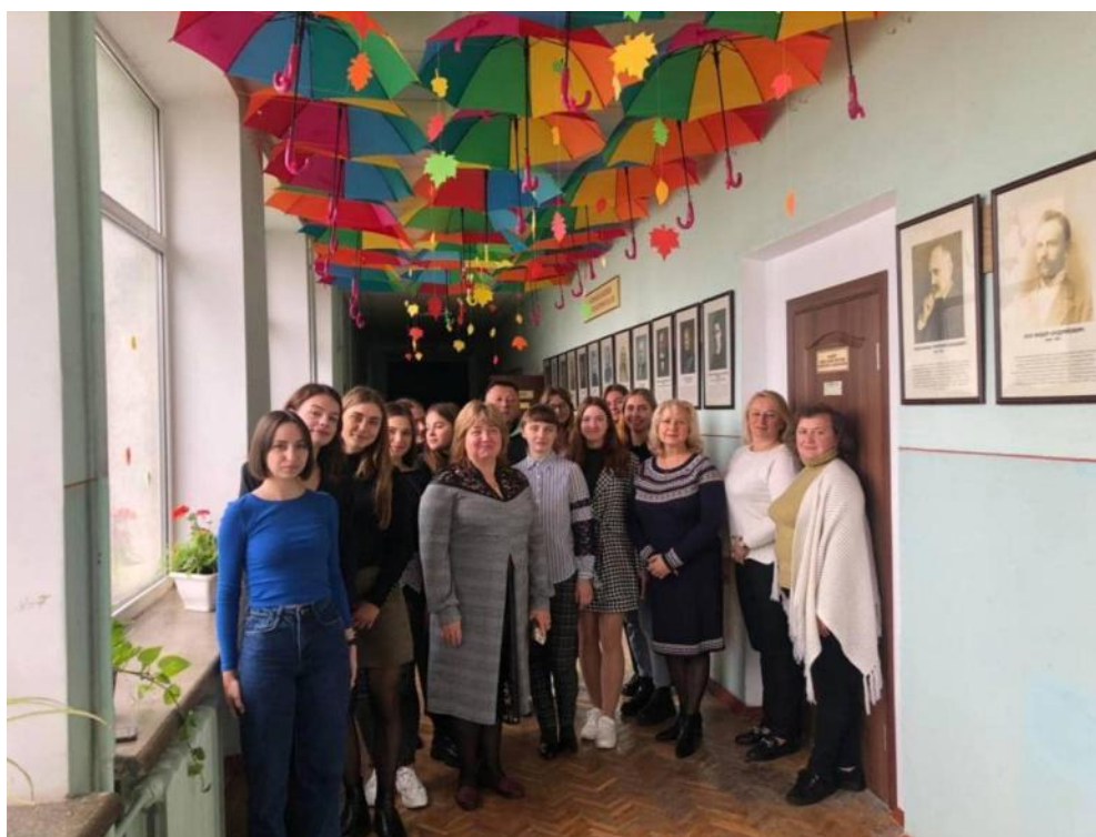
Освітнє середовище спеціальності 016 Спеціальна освіта