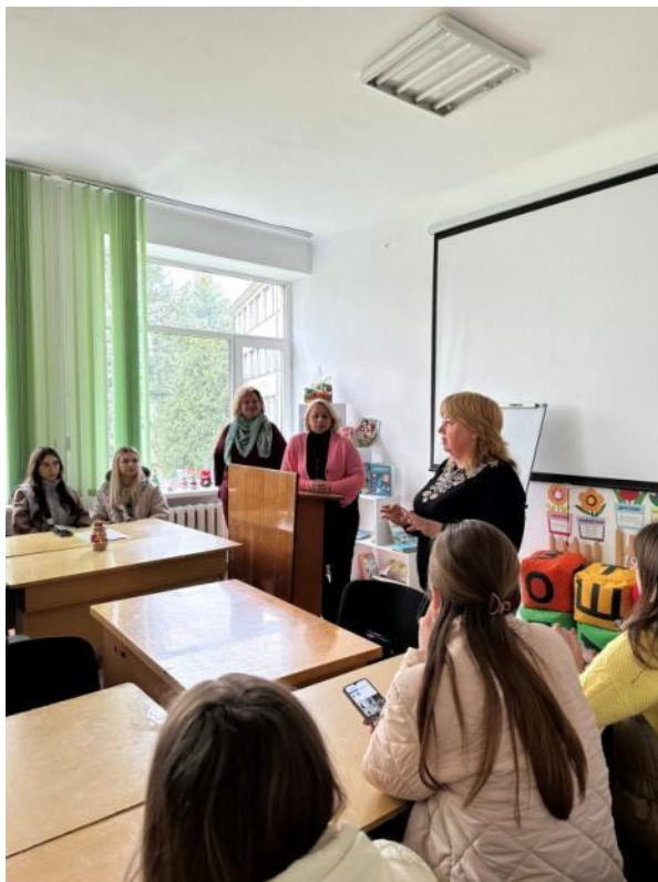
День кафедри спеціальної та інклюзивної освіти