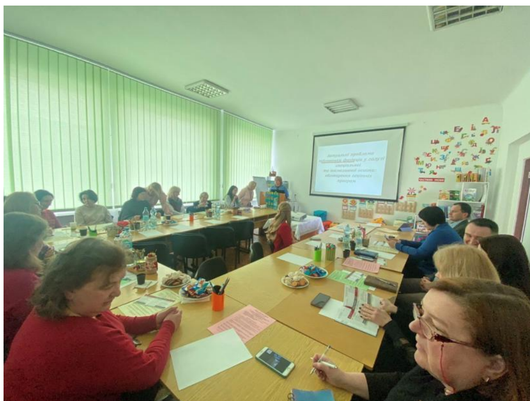
Круглий стіл (30 березня 2023)