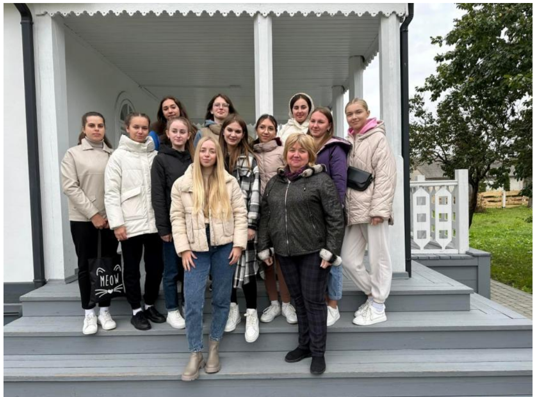
Зі студентами у Колодяжному (2023)