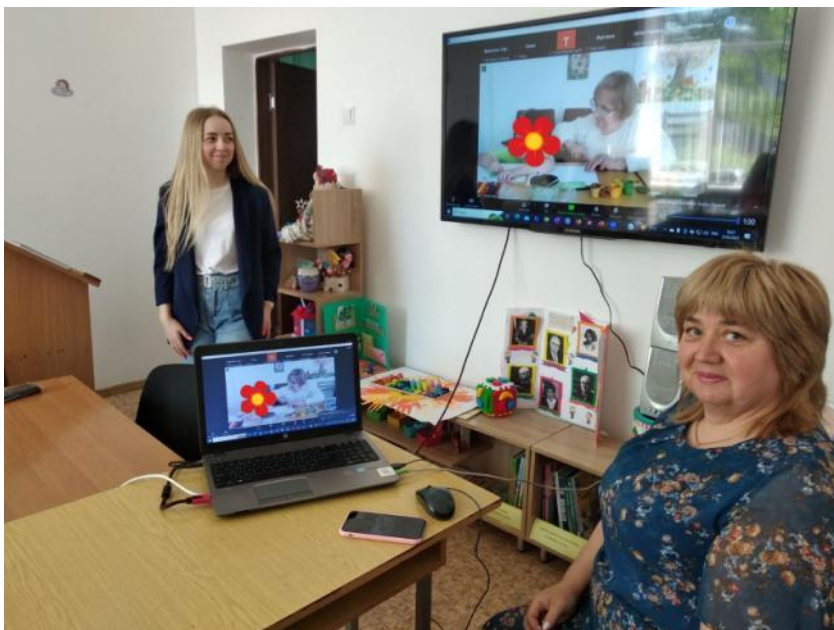
Робота семінару (2023)