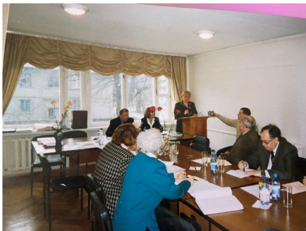
Захист канд. дисертації, НАПН України Інститут спеціальної педагогіки та психології, 2004 р.