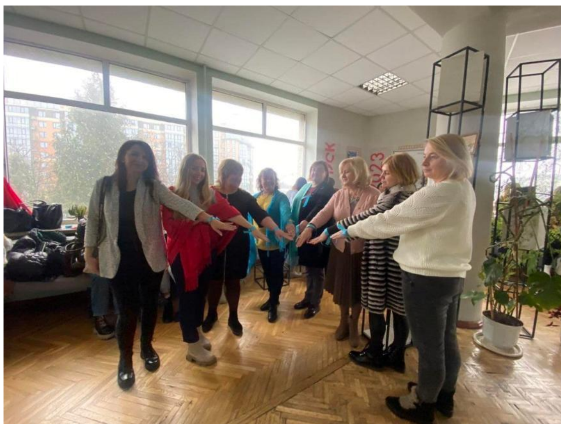
Акція Блакитні долоньки