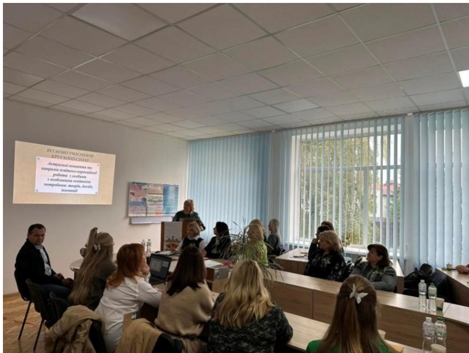
Робота круглого столу (1.10.2024)