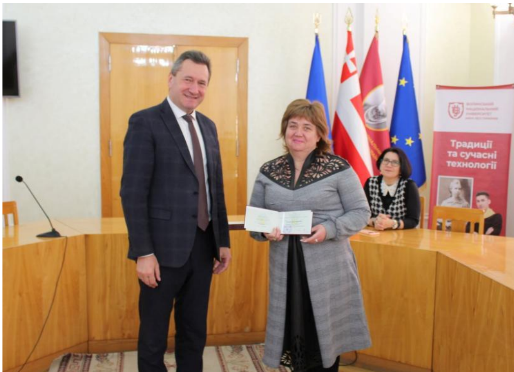
Вручення атестату професора, 2021