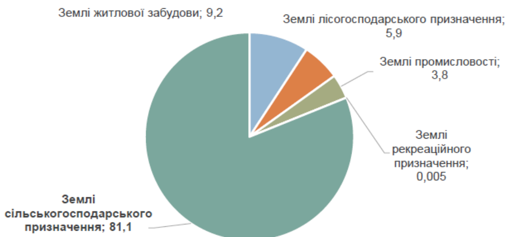
Рис. 2.1. Земельні ресурси Боратинської територіальної громади [56]

Земельні ресурси Боратинської територіальної громади становлять 20168,09 га, зокрема: – землі житлової забудови (1856,21 га); – землі лісогосподарського призначення – 1185,83 га; – землі під промисловими об'єктами – 764,25 га; – землі рекреаційного призначення – 1,00 га; – землі сільськогосподарського призначення – 16360, 80 га.