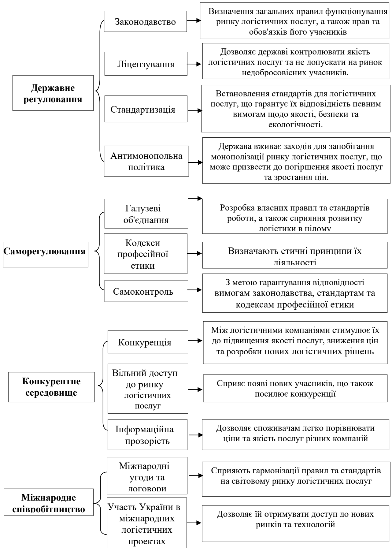
Рис. 2. Модель механізму регулювання ринку логістичних послуг