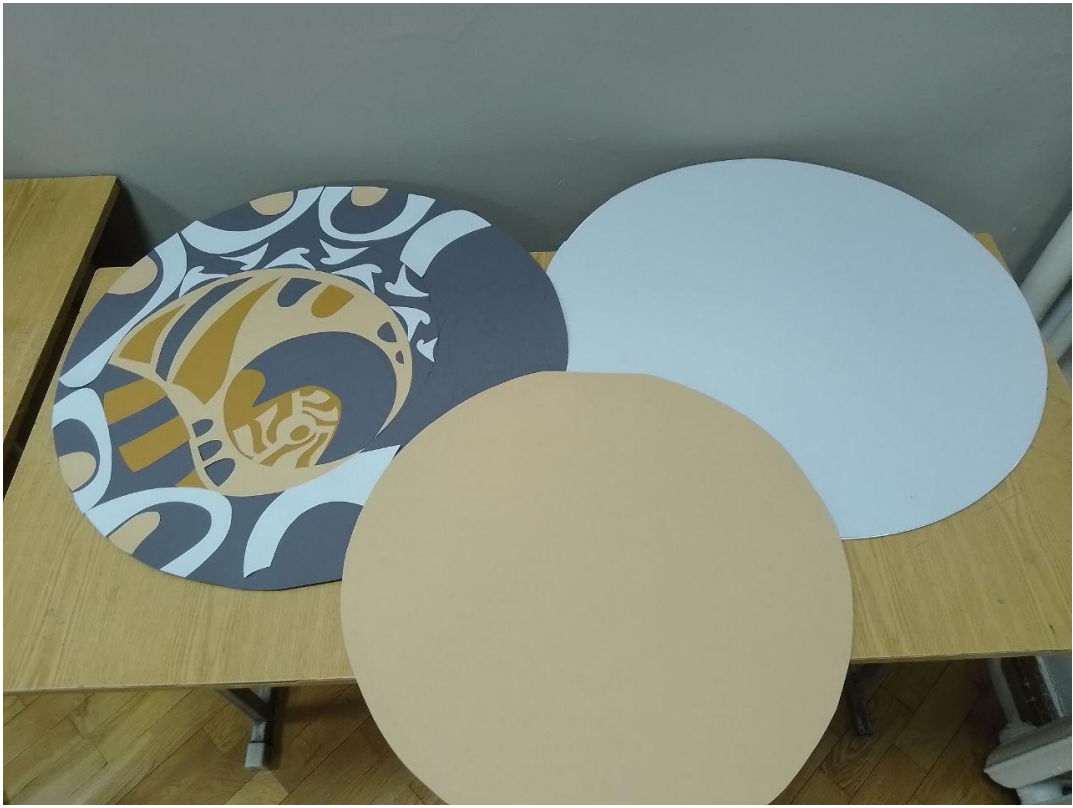
Рис.7. Колористичне вирішення