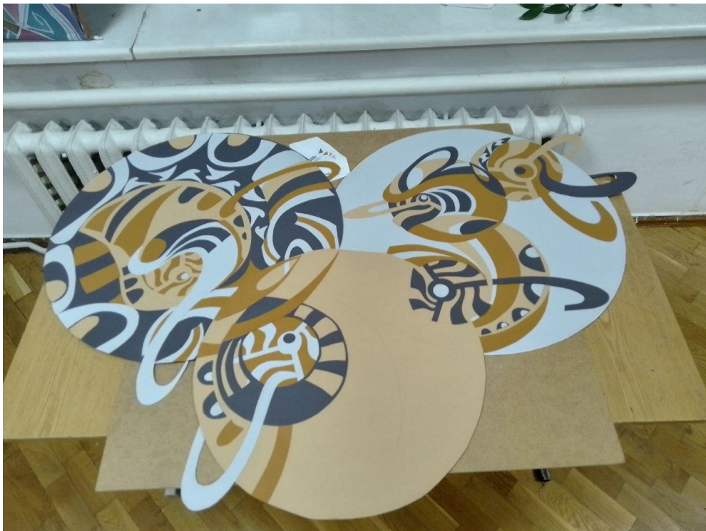
Рис.9. Процес витинання