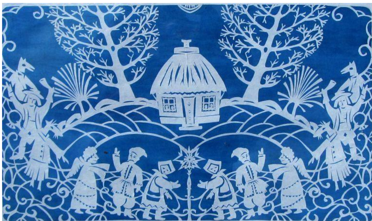
Рис.2. М. Гоцуляк, українська витинанка