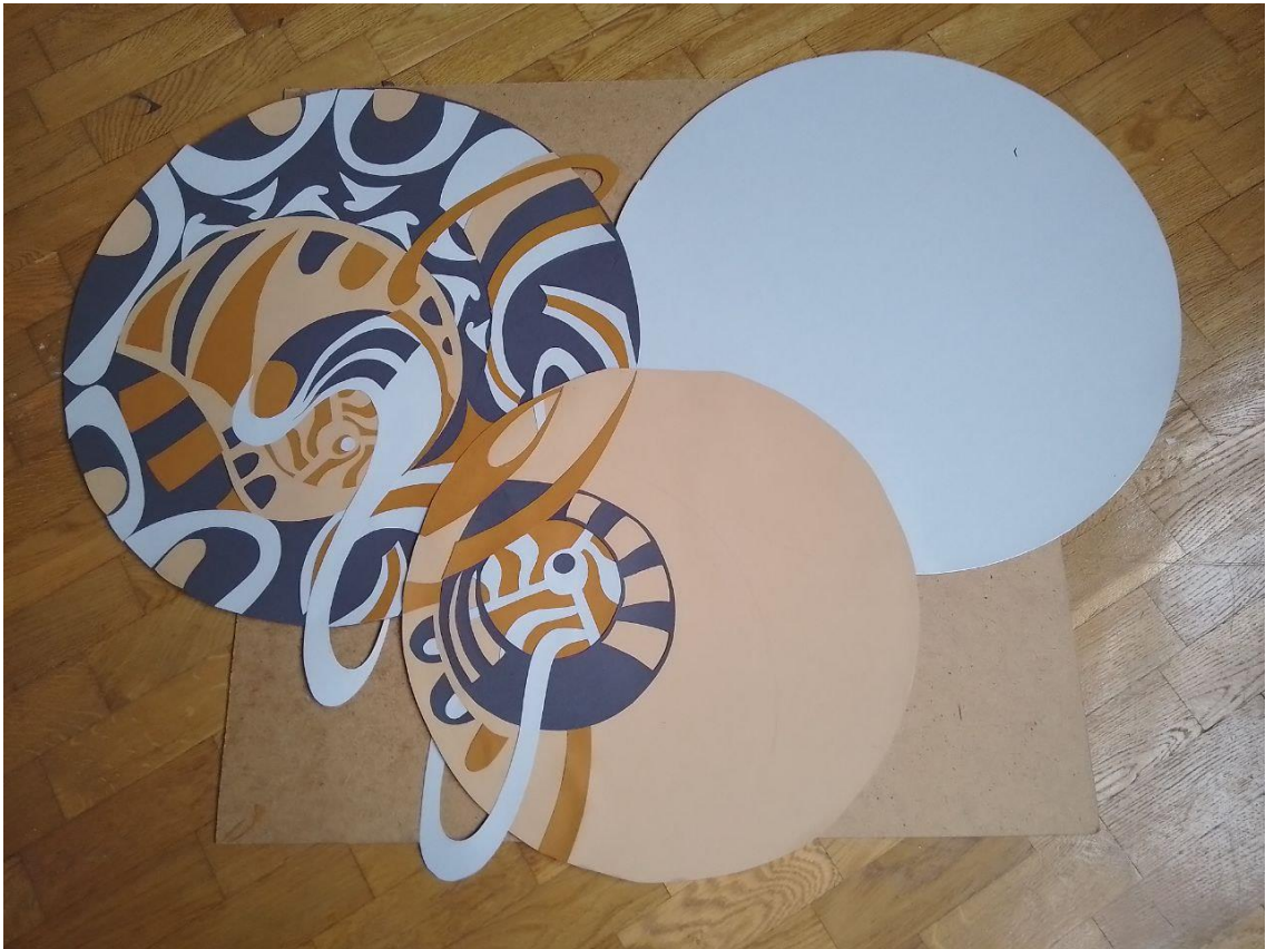
Рис.8. Процес витинання