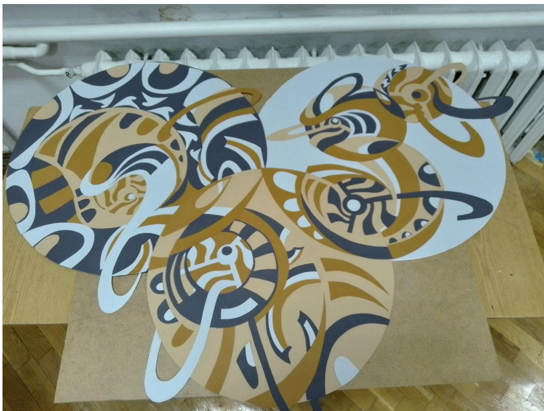
Рис.10. Процес витинання