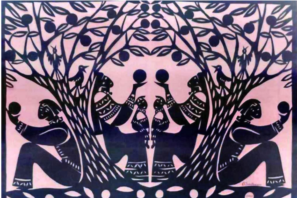
Рис.3. О. Городинська, українська витинанка «Сім'я», 2002 р.