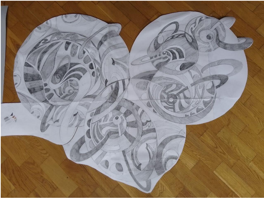
Рис.5. Розробка ескізу