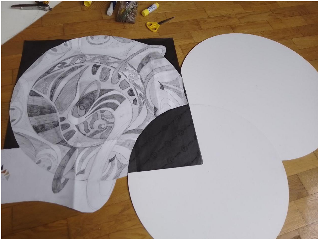
Рис.6. Перенесення ескізу в практичну частину