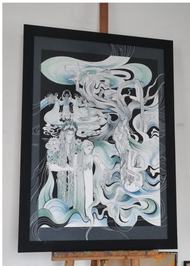
Рис. 2. Кінцевий результат роботи