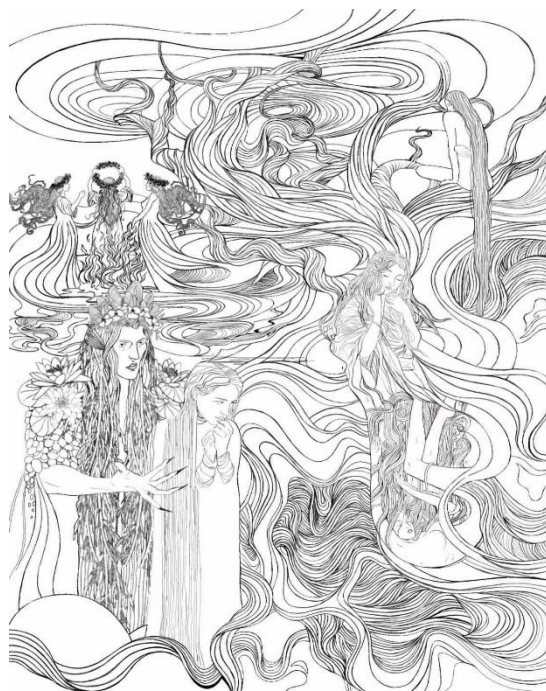
Рис.1. Поетапність виконання кваліфікаційної роботи