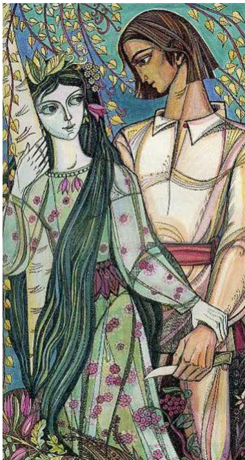
Рис. 1. Софія Караффа-Корбут ілюстрація до «Лісової пісні»