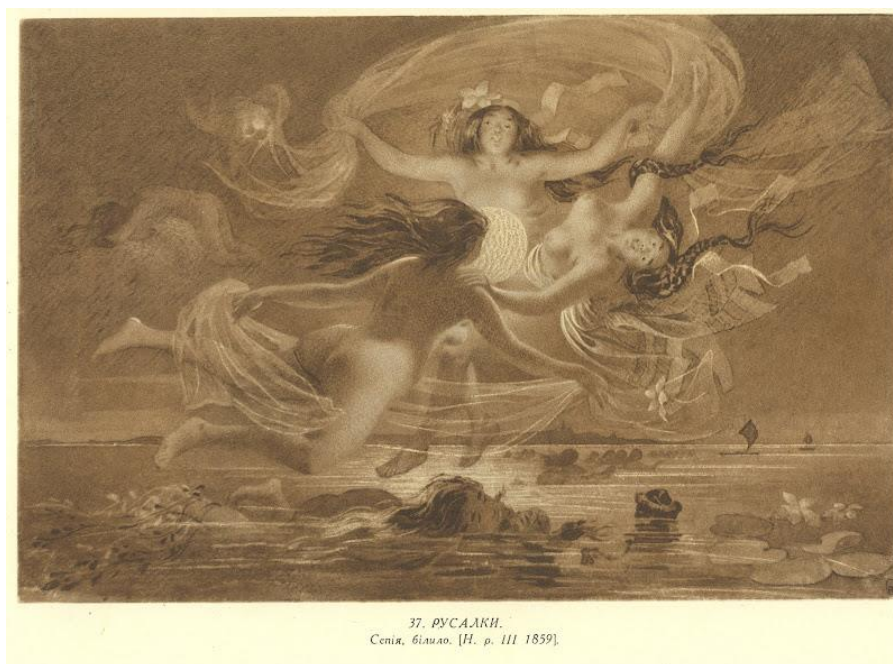
Рис.2 Тарас Шевченко «Русалки»