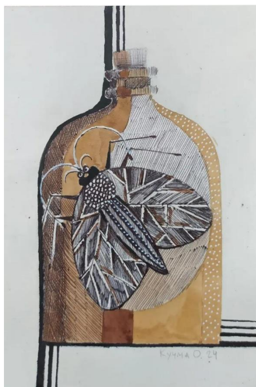
Рис 4 Ольга Кучма «Міль»