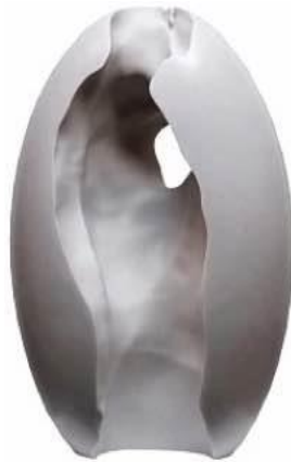
Назар Білік «Зріз», 2019