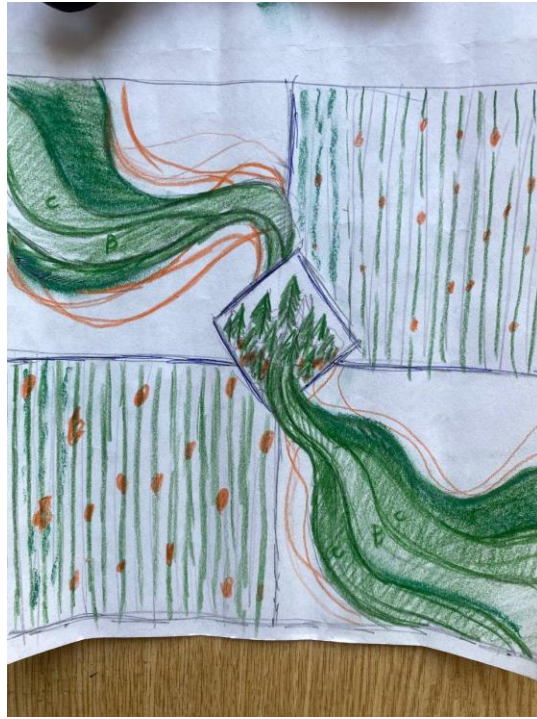
Ескіз кваліфікаційної роботи