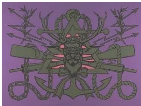
Микола Маценко «Півостір-2», 2012