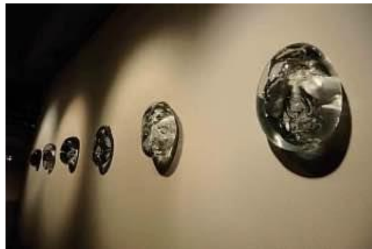
Назар Білік без назви