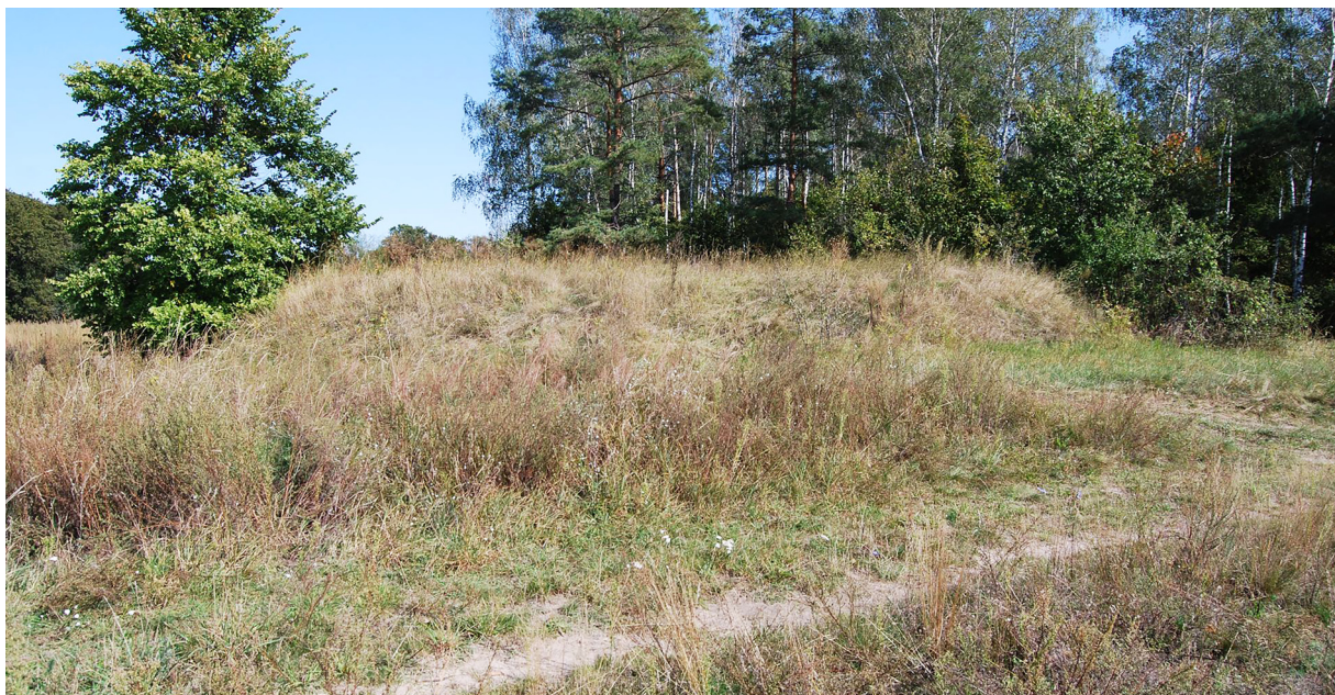
Рис. 2. Плаский курган. Вигляд із заходу (за: Скороход та ін. 2020, рис. 82)

Цей об'єкт під назвою «курган» був нанесений на плані археологічної пам'ятки в урочищі Трифоновщина, показаної у підсумовуючій публікації (Моця, Скороход, Сита 2021, рис. 1). З плану видно, що «курган» розміщений за 100 м на південь від посаду.