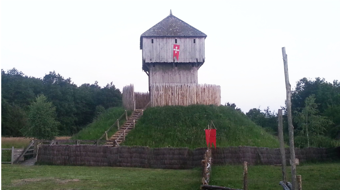
Рис. 4. Реконструкція зовнішнього вигляду «Motte» у час його функціонування як лицарського замку

конуса. Оточений ровиком. Поверхня щільно задернована. Розкопки не проводились» (Мултанен 2015, с. 115).