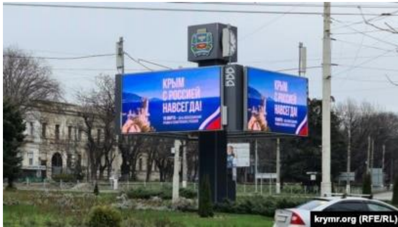
Рис.2.1. Російська пропаганда на території окупованого Криму 1

Пропагандисти акцентують увагу на періодах, коли Крим перебував під російським контролем, таких як часи Російської імперії та радянської доби, водночас ігноруючи історію Кримського ханства і позитивні зміни, пов'язані з Україною. Російська пропаганда використовує тактику напівправди, стверджуючи, що Крим історично належав Росії, але це не означає, що півострів є «споконвічно російським».