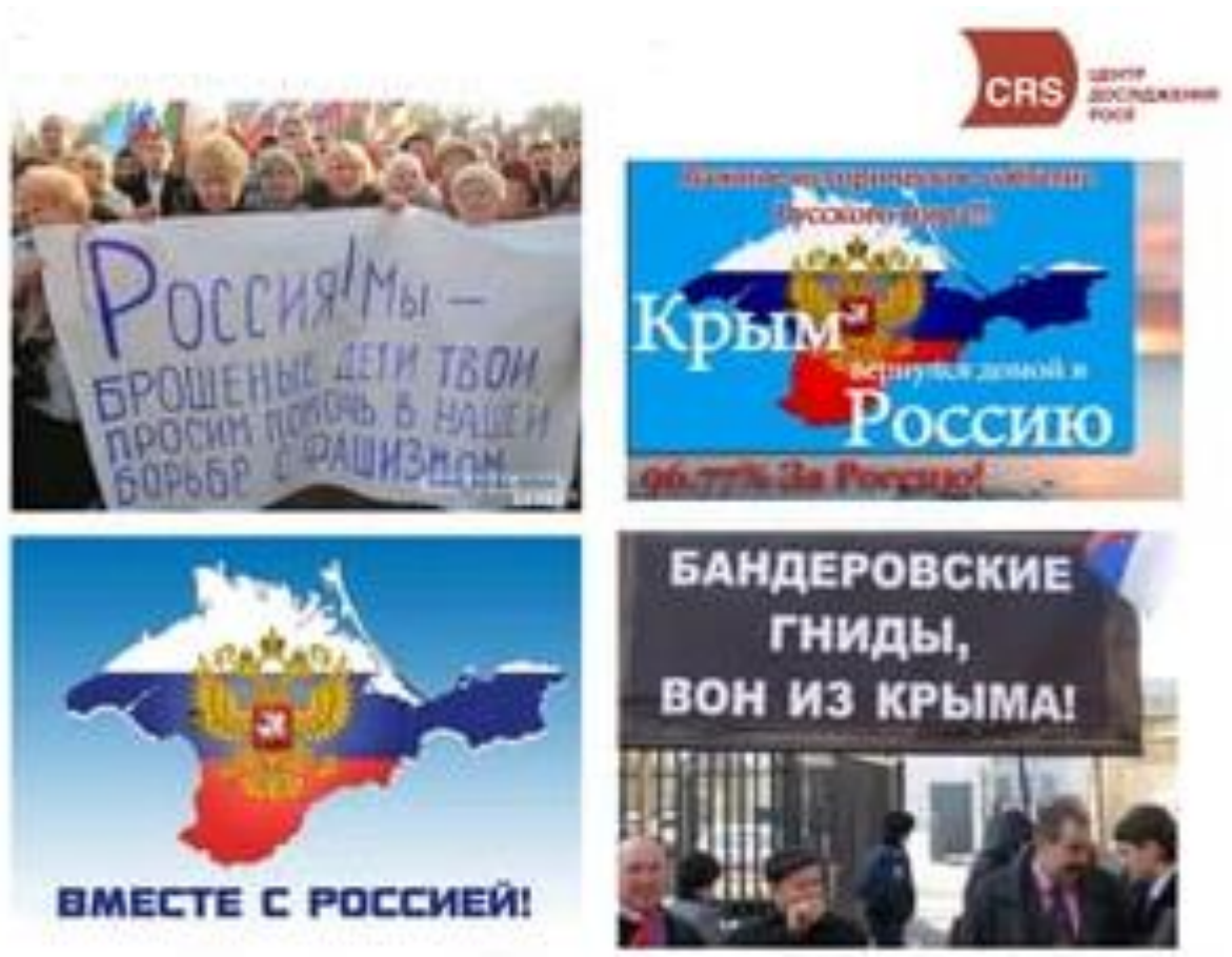
Рис.2.2 Російська пропаганда в Криму 1

З метою надання законного оформлення діям країни-агресора в Україні президент Москви В. Путін 1 березня 2014 р. звернувся до парламенту Москви з пропозицією дозволити використання Збройних Сил Російської Федерації на території України. Того ж дня ця пропозиція була прийнята 2 (В. Путін довго заперечував факт незаконного введення Москвою своїх військ на Кримський півострів взимку-навесні 2014 р., а на питання про зброю та форму цинічно