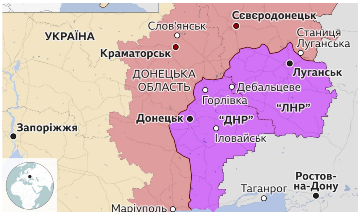
Рис.2.3. Незаконно утворені формування «ДНР» та «ЛНР»

півднем Росії. Зокрема, його бентежило, що приєднання південно-східних областей сучасної України було зроблене не озираючись на етнічний склад населення: «границы определялись совершенно произвольно и далеко не всегда обоснованно. На Украину, например, Донбасс передали» 1 . Згідно до аргументів пропаганди, знаходження Донбасу в складі УРСР, а пізніше незалежної України, також є «великою історичною помилкою». Апелюється до того, що Донбас історично не мав відношення до України, а в складі УРСР опинився через амбітні та недалекоглядні рішення радянських діячів 2 . Таким чином, подібно до анексії Криму, військова агресія та створення квазіутворень, так званих «ДНР» і «ЛНР», виправдовуються як відновлення історичної справедливості.