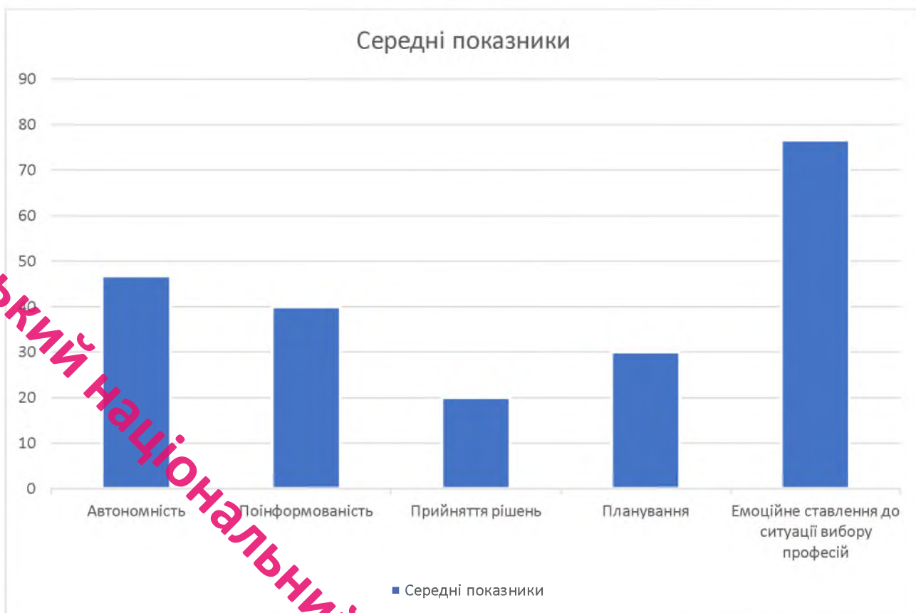
Рис.2.2. Середні показники готовності до вибору професії за методикою О. Чернявської

Показник поінформованості дорівнює 40%, що відображає середній рівень обізнаності здобувачів освіти щодо різних професій, вимог до них та можливостей професійного розвитку. Такий рівень вказує на потребу в покращенні інформаційного забезпечення учнів щодо різноманітних кар'єрних шляхів, особливо враховуючи специфіку їх навчання, де військово-фізична підготовка відіграє важливу роль. Низький рівень прийняття рішень (20%) свідчить про недостатню здатність учнів самостійно приймати обґрунтовані рішення, що є критичним аспектом для успішного професійного самовизначення та адаптації в майбутньому професійному середовищі.