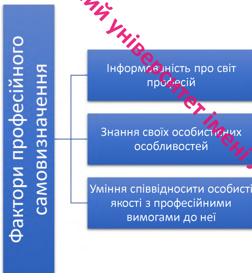
Рис. 1.1. Фактори які впливають на професійне самовизначення [51]

Для того, щоб вибір професії став результатом обдуманого й свідомого рішення, необхідно враховувати ряд ключових факторів (рис.1.1.), які визначаються як інформованість про світ професій, знання власних особистісних особливостей та уміння співвідносити ці особистісні якості з професійними вимогами.