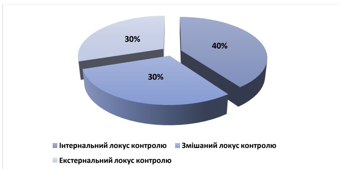
Рис.2.2. Кількісні показники рівня відповідальності за методикою «Локус контролю» (Дж. Роттер)

Водночас, існують учні з низьким рівнем мотивації, які потребують індивідуального підходу, спрямованого на підвищення їхньої впевненості та зацікавленості у навчанні. Ці результати дозволяють розробити рекомендації для батьків і педагогів, які допоможуть ефективно підтримувати мотивацію учнів.