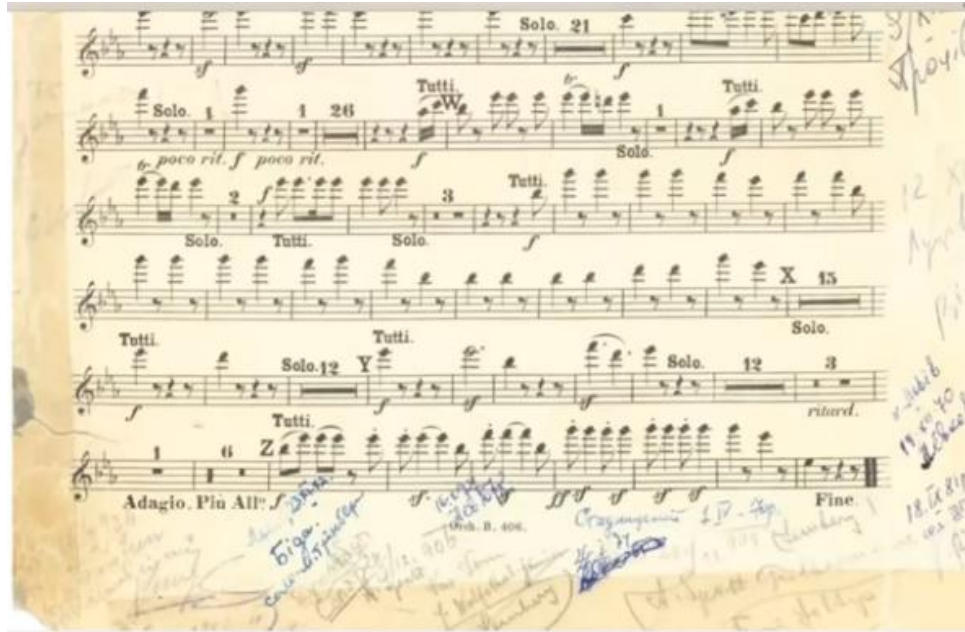
Підписи львівських музикантів-духовиків на оркестровій партії