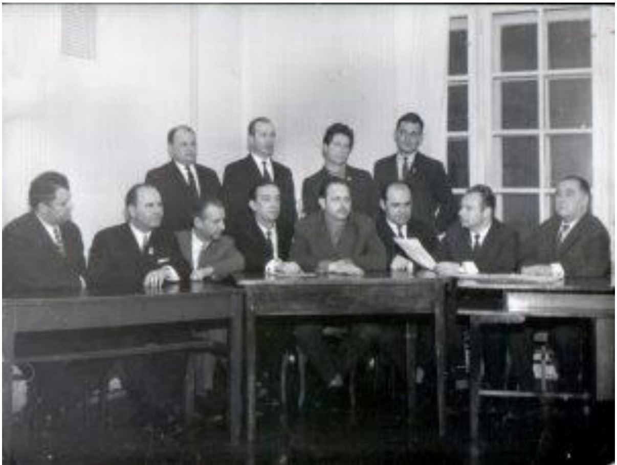
Кафедра духових та ударних інструментів Львівської державної консерваторії (1969 р.)