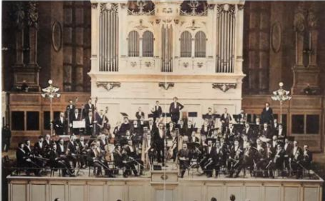
Перший філармонічний оркестр Львова