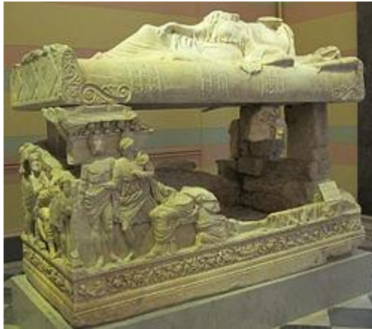
Саркофаг з Мірмекій