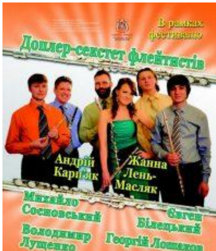
Обкладинка компакт-диску «The Concert in the town of Lions» (2006)

У подальшій діяльності флейтовий квартет здобув низку почесних відзнак, зокрема, звання лауреата Міжнародного конкурсу духових камерних ансамблів (Київ, 2004), випустив компакт-диск «The Concert in the town of Lions» (2006), продовжує брати активну участь у багатьох музичних фестивалях, зокрема, International Youth Music Forum, «КиївМузикФест», «Віртуози», «Контрасти», «Хмельницький камер-фест», співпрацюючи з