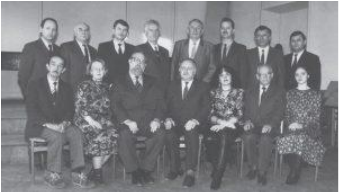
Кафедра духових та ударних інструментів (1993 р.)

З часу відкриття кафедри на денній та заочній формах навчання було підготовлено близько тисячі фахівців, що працювали та продовжують працювати в оркестрах, мистецьких і навчальних закладах України, Європи, Америки, Азії. Високий рівень духової виконавської культури Львова сприяв появі нового репертуару для духових інструментів, створеного львівськими композиторами Р. Сімовичем, М. Скориком, М. Копитманом, В. Цайтцом, В. Камінським, О. Козаренком, Б. Фроляк, І. Небесним, В. Квасневським, Л. Сидоренко, Б. Борисенком, О. Криволап, Л. Думою та ін. [24; 26; 27; 44].