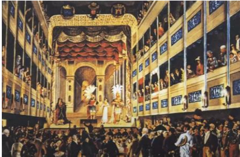
Львівський театр початку ХІХ століття

І відразу до театру в той час (в першій половині ХІХ століття) примикав т. зв. Редутний зал, в якому відбувалися бали і також концерти.