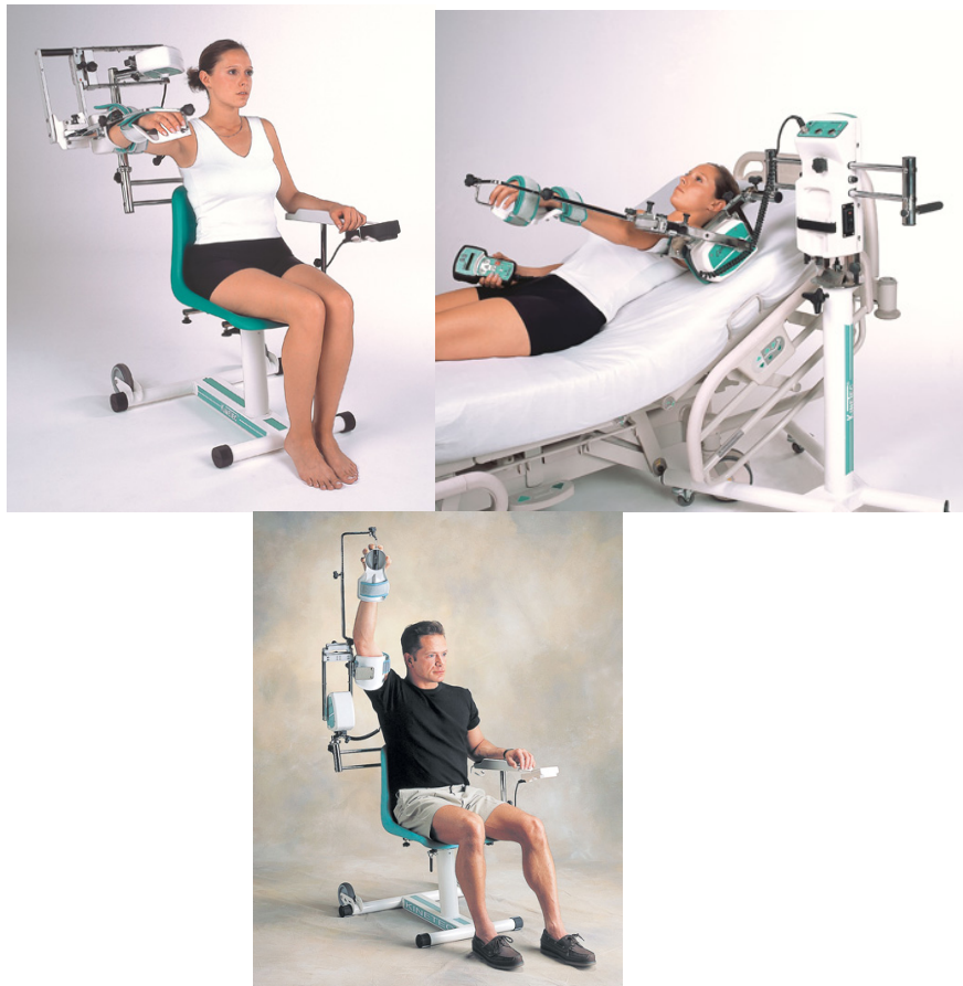
Рис. 1. Загальний вид тренажера Kinetec Centura 5 shoulder CPM

Модифікація РТ без крісла може використовуватися як приліжкова модель (для лежачих пацієнтів) або для пацієнтів у інвалідних візках.