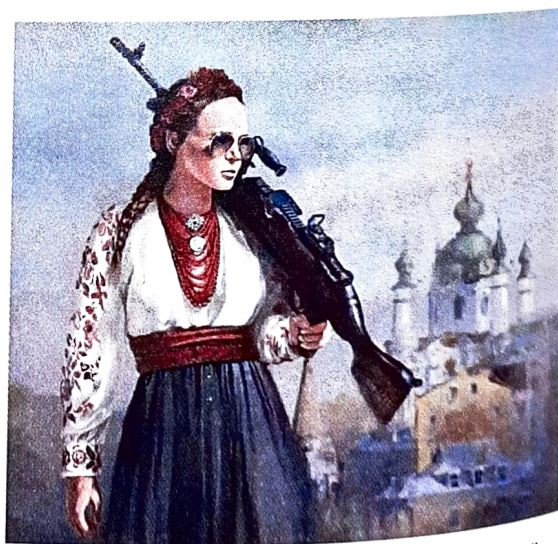
Рис. 4. Приклади образу жінки для візуальної репрезентації української національної ідентичності

Помаранчева революція, яка відбулася в Україні у 2004 р., Революція Гідності у 2013–2014 рр. та усі подальші події стали потужним стимулом для відродження української національної свідомості. Саме відтоді розуміння укра-