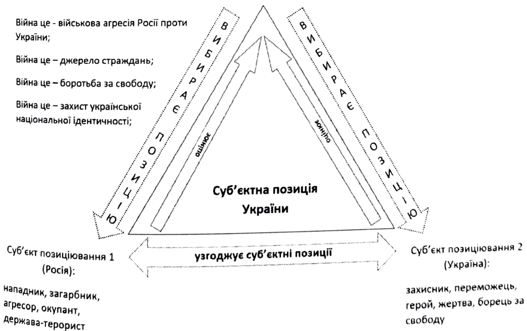
Рис. 2. Трикутник стансу, у якому Україна виступає колективним суб'єктом позиціонування