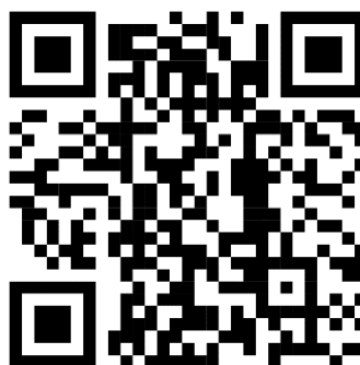
Рис. 3.1 – Посилання на онлайн-ресурс «Kazka.Fun»

Гра «Я чи штучний інтелект». Використовуючи штучний інтелект Kazka.fun (рис. 3.1), створи казку героєм якої буде волинський письменник. (Задай відповідні промти: обері категорію, героя, сюжет). Перевір пунктуацію в казці. Знайди другорядні члени речення якими поширює текст ШІ, чи скрізь правильно узгоджені другорядні члени речення з головними. Зроби висновок на скільки ШІ створив художньо забарвлений текст, чи розуміється він на правилах української мови, чи припускається помилок?