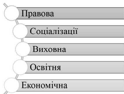
Рис. 1. Функції інклюзивної освіти