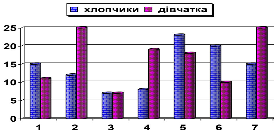
Рис. 2.4. Результати виконання методики «Хто Я?» (М. Куна, Т. Макпартленда) хлопчиками і дівчатками школи-інтернату (%) (ЕГ – 2024)

Примітка: 1 – соціальне Я; 2 – комунікативне Я; 3 – матеріальне Я; 4 – фізичне Я; 5 – діяльне Я; 6 – перспективне Я; 7 – рефлексивне Я.