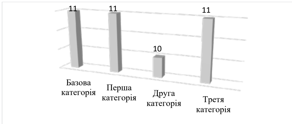
Рис. 3. Кількість садіб за категоріями, які отримали сертифікат «Українська гостинна садиба», 2024 р.

линий хутір» (Чернігівська область). Садиби «Диканька» та «Веселка» входять до кластеру «Особисте селянське господарство «Сьоме небо».