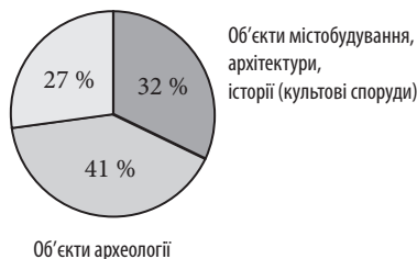
Рис. 2. Структура сакральної культурної спадщини України

Об'єкти історії, архітектури, монументального мистецтва (некрогрупа)