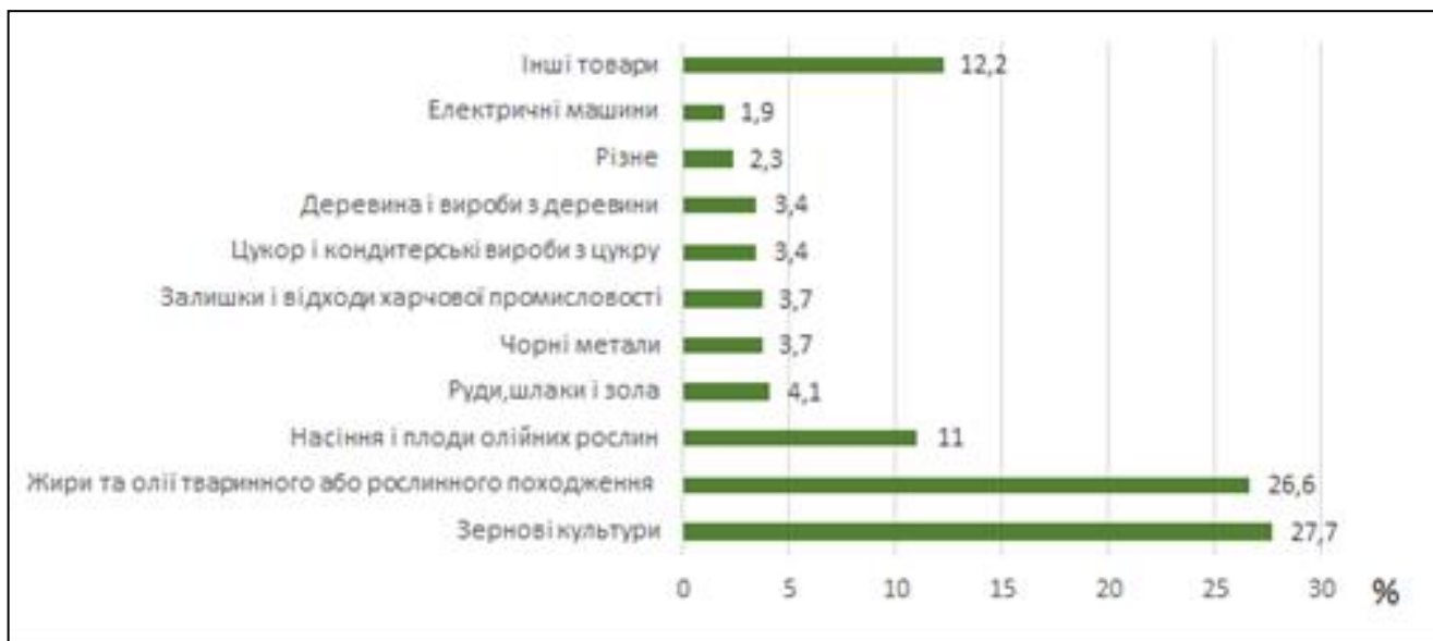
Рис. 2. Товарна структура експорту товарів із України в Румунію в 2023 р.

Товарна структура експорту українських товарів до Румунії в останні роки зазнала помітних змін. Зокрема, в 2023 р. відносно 2022 р. відбулося збільшення експорту по деяких товарних позиціях. Особливо зросли обсяги постачання таких товарів, як жири та олії рослинного походження (на 16 %), засоби наземного транспорту крім залізничного (на 10 %), реактори ядерні, котли, машини (на 29,7 %), органічні хімічні сполуки (в 3,9 раза), маса з деревини (в 5 разів), мідь і вироби з неї (в 7 разів) та ін. Проте окремо слід відзначити значне зменшення в 2023 р. обсягів експорту в Румунію таких важливих товарів, як зернові культури (-15,9 % відносно 2022 р.), чорні метали (на 41,2 %), електричні машини (на 41,8 %) [2].