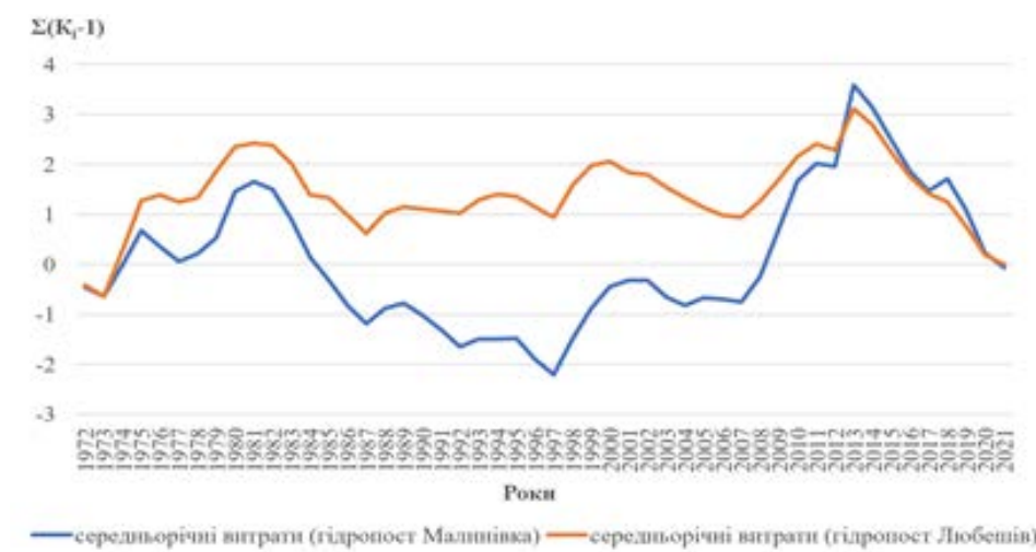
Рис. 1. Різницеві криві середньорічних витрат р. Стохід на гідропосту Малинівка (верхня течія) та гідропосту Любешів (нижня течія) (розраховано й побудовано за даними ВОЦГМ)

Для визначення циклічності аналізованих гідрометеорологічних параметрів для обох гідропостів було побудовано різницеві інтегральні криві (рис. 1–3). Вони демонструють цикли та фази коливальності й дають змогу визначити її схожість/відмінність у верхній і нижній частинах течії річки. Період часу, для якого лінія інтегральної кривої відхиляється вгору відносно осі абсцис, а середнє значення ( K_1 - 1 ) є додатним, відповідає багатоводній фазі коливальності стоку. Період же, для якого ця лінія нахилена вниз, а середнє значення ( K_1 - 1 ) має від'ємні значення, відповідає маловодній фазі [15, с. 92].