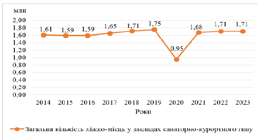
Рис. 2. Загальна кількість ліжок-місць у закладах санаторно-курортного типу в Німеччині у 2014–2023 рр.

Лідерами за кількістю туристичних прибуттів є бальнеологічні курорти (16,61 млн). На другому місці – курорти відпочинку з кількість прибуттів 14,81 млн. Туристичні прибуття на морські курорти становлять 10,78 млн. Бальнеологічні, морські курорти та курорти відпочинку, зазвичай, більш популярні серед широкої аудиторії відпочиваючих, оскільки пропонують загальне оздоровлення, релаксацію та розваги. Туристи часто обирають такі курорти для відпустки й відпочинку. Курорти відпочинку та морські курорти підходять для різних цільових аудиторій: сімей, молоді, літніх людей. Вони пропонують різноманітні види діяльності, що робить їх універсальними для відпочинку. Мінеральні й грязьові та кліматичні курорти мають середні значення прибуттів, оскільки часто призначені для лікування конкретних захворювань, що обмежує їх цільову аудиторію порівняно з курортами загального призначення. Кліматичні лікувальні й водолікувальні курорти за методом Кнейпа мають найменшу кількість прибуттів – 4,74 і 2,71 млн відповідно. Ці типи курортів можуть мати більш обмежений сезон і потребують спеціальних умов, що знижує їх загальну популярність.