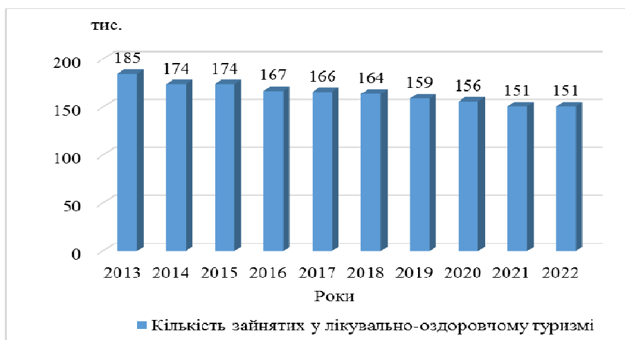
Рис. 8. Зайнятість у лікувально-оздоровчому туризмі в Німеччині у 2013–2022 рр.

За даними опитування щодо готовності витратити гроші на здоров'я, проведеного в Німеччині у 2023 р., серед німецькомовного населення віком від 14 років і старше нараховувалося близько 24,52 млн осіб, для яких здоров'я та гарне самопочуття були настільки важливими, що вони були готові витратити на них значні кошти. Кількість населення, яке готове витратити гроші на своє здоров'я та самопочуття, зростала протягом останніх п'яти років із 23,8 до 24,5 млн осіб (Lohmeier 2024). Це вказує на значний потенціал для розвитку лікувально-оздоровчого туризму в Німеччині.