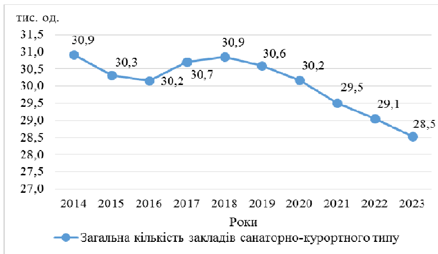
Рис. 1. Загальна кількість закладів санаторно-курортного типу в Німеччині у 2014–2023 рр.

Аналіз динаміки кількості СКЗ у Німеччині в 2014–2023 рр. показує поступове щорічне скорочення їх кількості з 2018 р. з 30,9 тис. до 28,5 тис. ( рис. 1 ). Причини такої тенденції можуть бути пов'язані з економічними чинниками або зміною попиту на лікувально-оздоровчі послуги. Загалом протягом 2014–2023 рр. кількість СКЗ у Німеччині скоротилася на 8,1 %. Найбільш стрімке скорочення кількості закладів відбулося у 2019–2023 рр., що є наслідком впливу Covid-19.