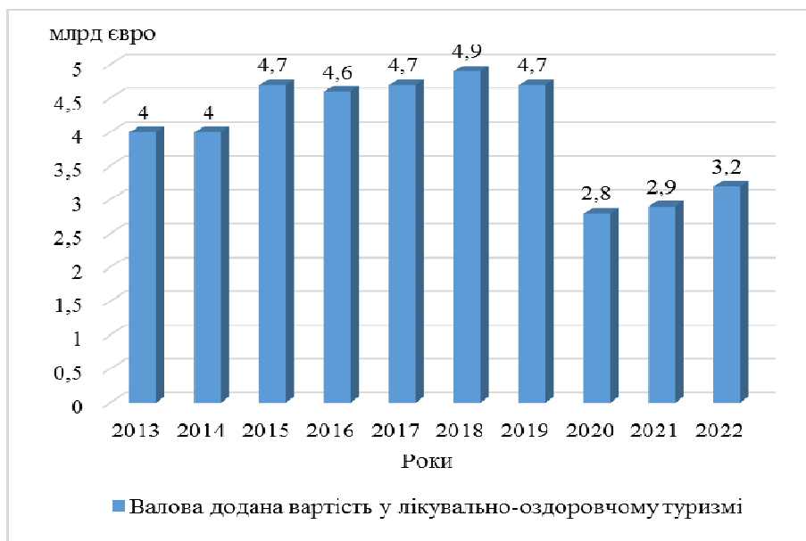
Рис. 7. Валова додана вартість у лікувально-оздоровчому туризмі в Німеччині у 2013–2022 рр.

послугами. У Німеччині у сфері лікувально-оздоровчого туризму у 2022 р. працювали 151 тис. осіб, що є найнижчим показником із 2013 р. (Neumann 2024b) (рис. 8). Можна зробити припущення, що зменшення працівників у сфері лікувально-оздоровчого туризму частково пов'язане з дефіцитом медичного персоналу в Німеччині.