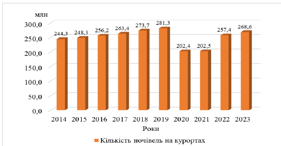
Рис. 6. Кількість ночівель на курортах Німеччини у 2014–2023 рр.

Лікувальна-оздоровчий туризм відіграє значну роль в економіці Німеччини. У 2022 р. валова додана вартість (ВДВ) у лікувально-оздоровчому туризмі Німеччини склала близько 3,2 млрд євро, що на 0,3 млрд євро більше за показник 2021 р. (Neumann 2024a) (рис. 7). ВДВ у лікувально-оздоровчому туризмі є показником, який відображає економічний внесок цього сектору туристичної галузі в економіку країни. ВДВ у лікувально-оздоровчому туризмі вимірює додану вартість, що створюється в процесі надання курортних, оздоровчих, лікувальних та інших супутніх послуг туристам. Динаміка ВДВ у 2013–2022 рр. показує значне зменшення її обсягу з 2020 р.