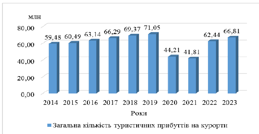
Рис. 3. Кількість туристичних прибуттів на курорти Німеччини у 2014–2023 рр.

Аналіз динаміки туристичних прибуттів у розрізі основних типів курортів Німеччини показав, що найбільше падіння показника у 2020 р. спостерігалось на мінеральних і грязьових (45,2 %), бальнеологічних (41,7 %) курортах та курортах за методом Кнейпа (40,5 %) (рис. 4). Менше, але все одно значне падіння, було на курортах відпочинку, кліматичних та кліматичних лікувальних курортах (35–37%). У 2021 р. падіння уповільнилося, але продовжувалося на всіх типах курортів. Найбільше воно було на кліматичних лікувальних курортах – 14,5 %. На інших курортах падіння знаходилося в межах 2,1–7,6 %.