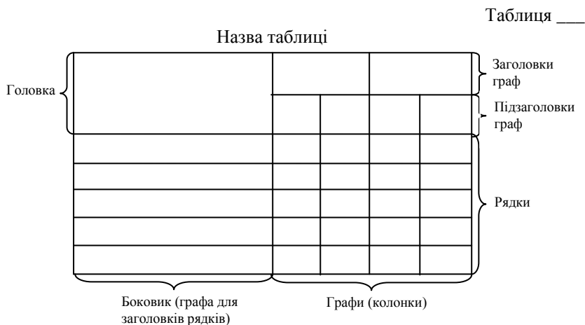
Рис. 3.1. Приклад побудови таблиці

Кожна таблиця повинна мати назву, яку розміщують над таблицею і друкують симетрично до тексту. Назву і слово «Таблиця» починають з великої літери. Назву не підкреслюють.