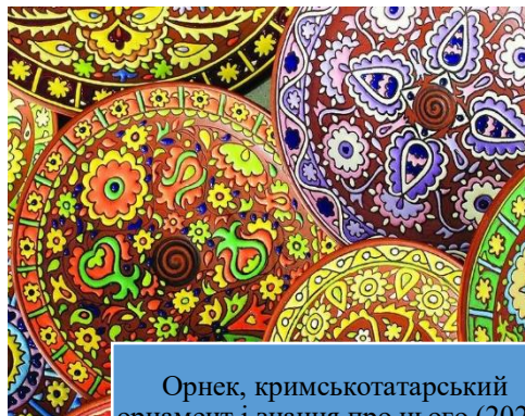
Орнек, кримськотатарський орнамент і знання про нього (2021)