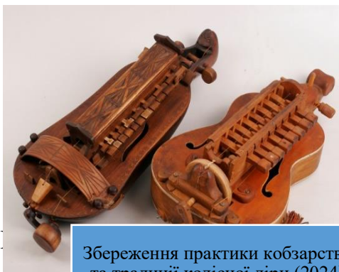
Збереження практики кобзарства та традиції колісної ліри (2024)