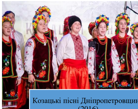
Козацькі пісні Дніпропетровщини (2016)