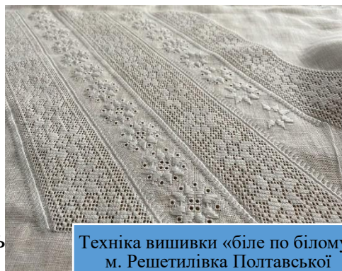
Техніка вишивки «біле по білому» м. Решетилівка Полтавської області (2024)