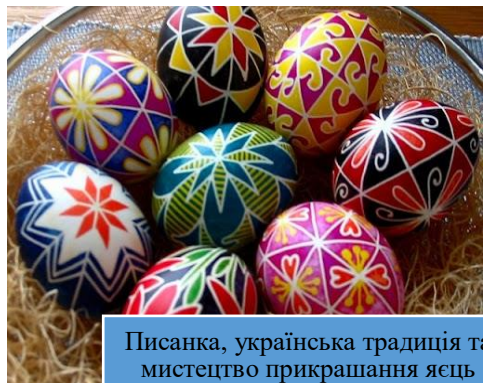
Писанка, українська традиція та мистецтво прикрашання яєць (2024)