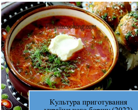
Культура приготування українського борщу (2022)