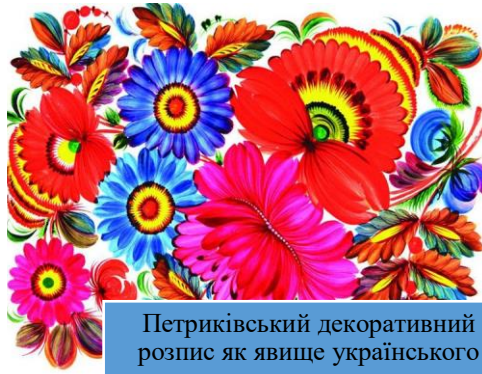
Петриківський декоративний розпис як явище українського орнаментального народного мистецтва (2013)