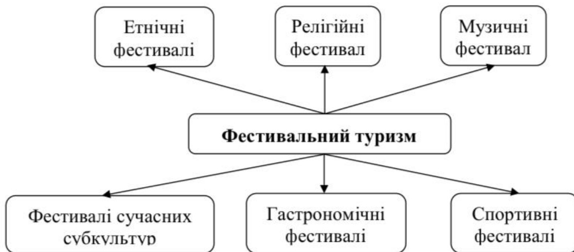
Рис. 1.1. Тип ізац ія фес тив

На сьогодні існує кілька класифікацій як фестивалів, так і фестивальних турів, які розробили українські та закордонні вчені. Однією з перших класифікацій фестивалів, запропонованих українськими вченими, є класифікація Ю. Грицьку-Андрієш та Ж. Бучко (2010 р.), яку багато дослідників використовують як загальноприйнятну класифікацію фестивального туризму (рис.1.1).