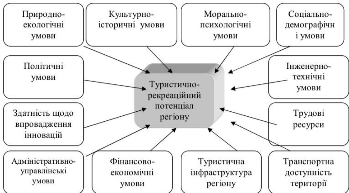
Рис. 1.1. Детермінанти туристично-рекреаційного потенціалу регіону [10, с. 13]

Туристично-рекреаційний потенціал є досить широким поняттям, що має численні детермінанти, які визначають туристично-рекреаційну привабливість певного регіону (рис. 1.1).