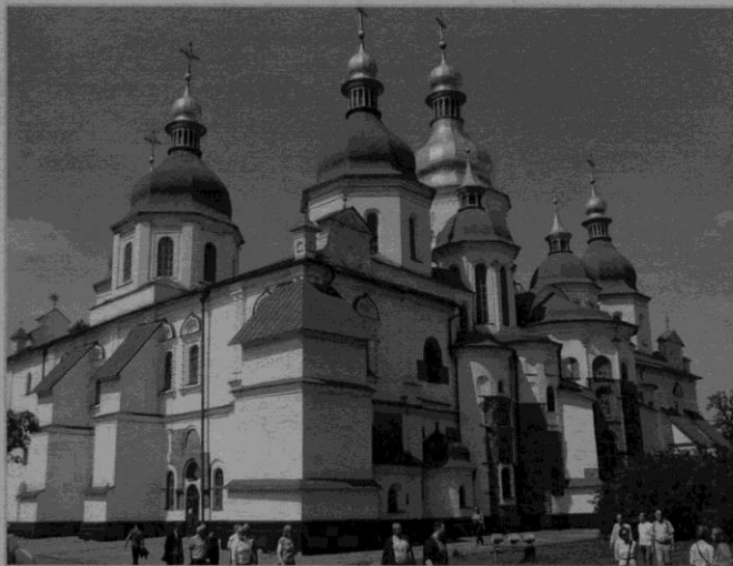
Софійський собор у Києві