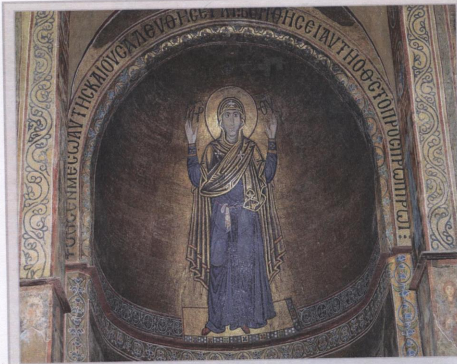
Богородиця-Оранта Мозаїчна композиція в центральній апсиді собору

4. В результаті встановлено такі якісні показники пам'ятки: