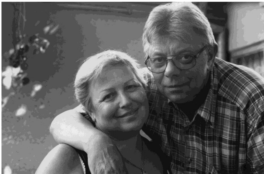
Понад 40 років разом