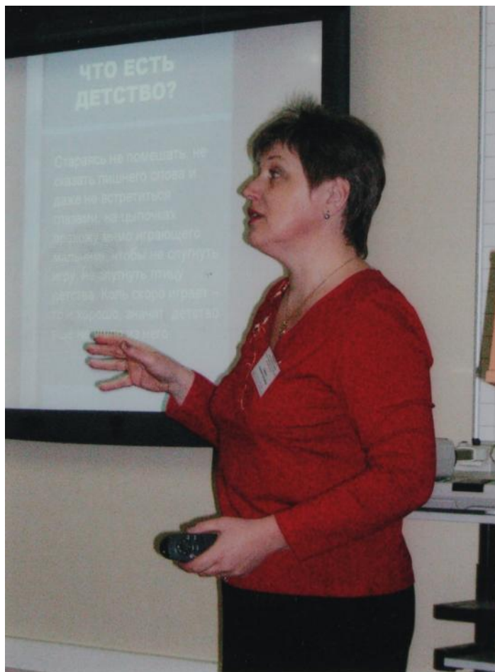
Виступ на науково-практичній конференції в Луганському університеті імені Т. Шевченка