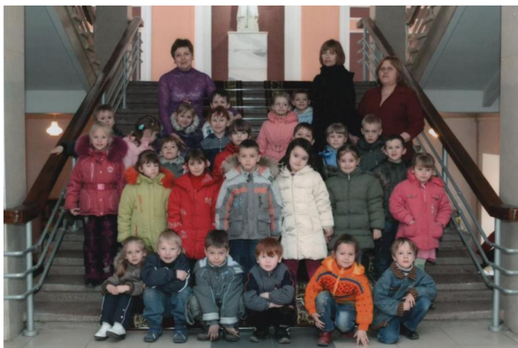
Наші діти: разом на екскурсії в університеті