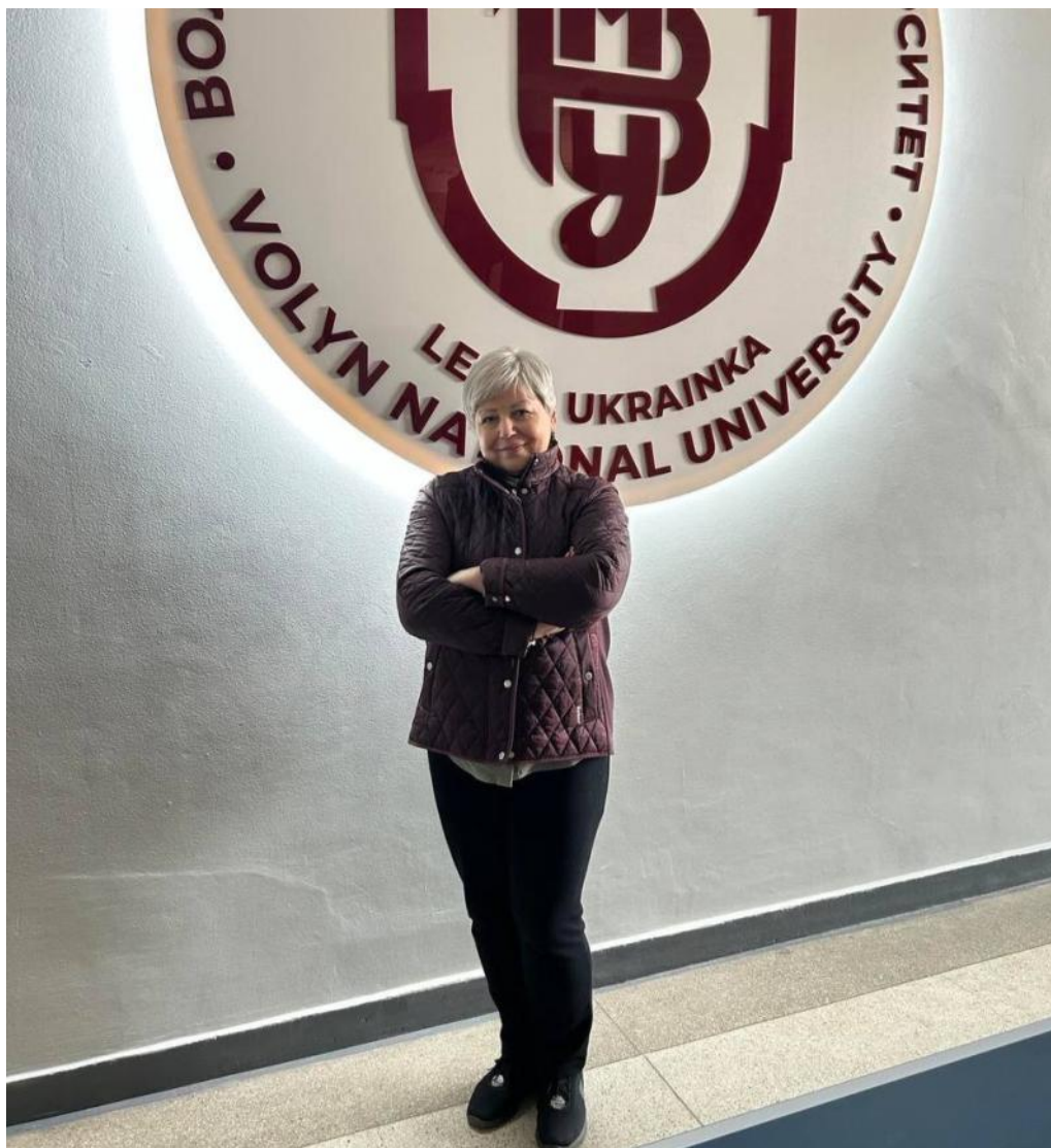
У Волинському національному університеті ім.. Лесі Українки