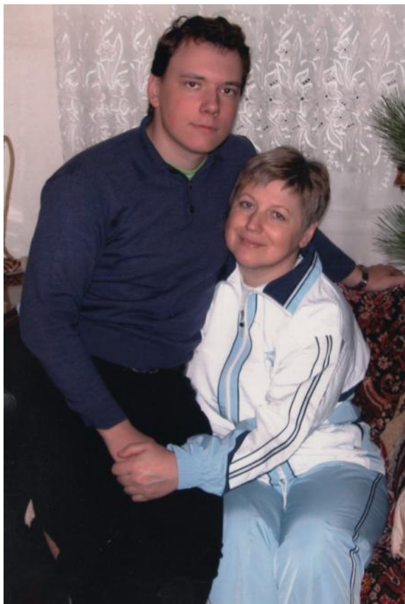
Моя мотивація і натхнення – син