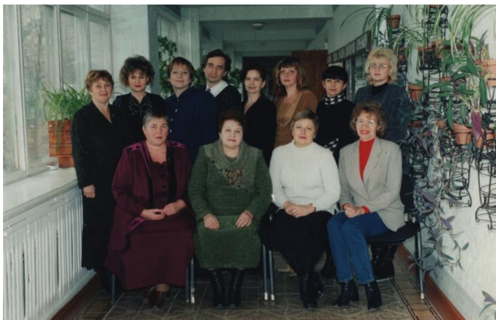
В період роботи в Слов'янському (нині Донбаському) державному педагогічному університеті. З колегами – викладачами кафедри дошкільної освіти