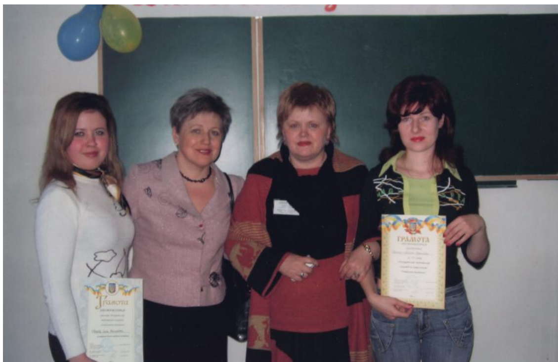
У складі журі Всеукраїнської студентської облімпіади з дошкільної освіти (м. Умань, 2007)