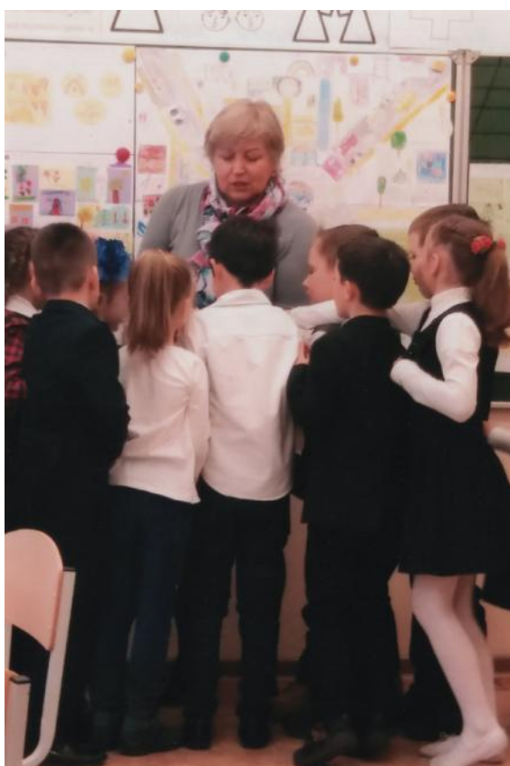
Діти: відкрите заняття (м. Київ, 2018)