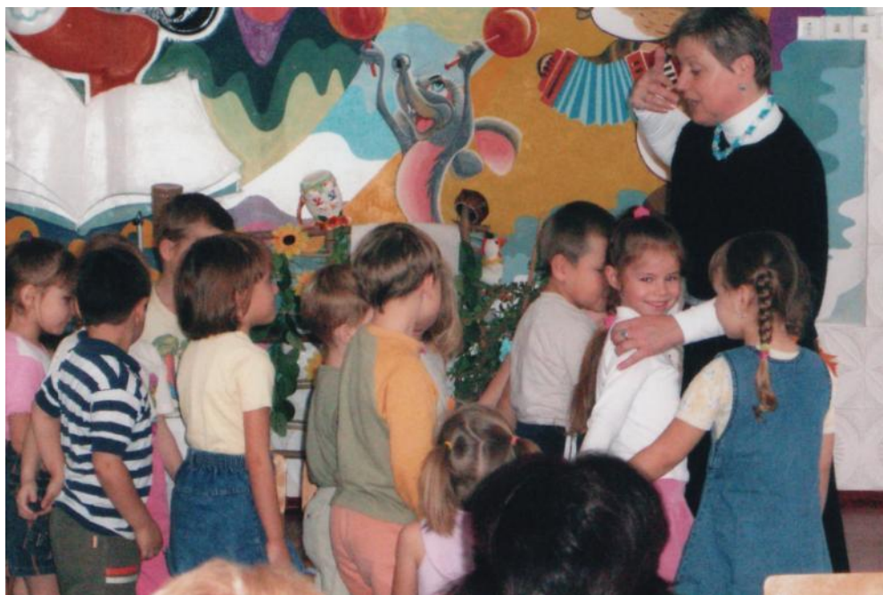
Діти: інтегроване заняття