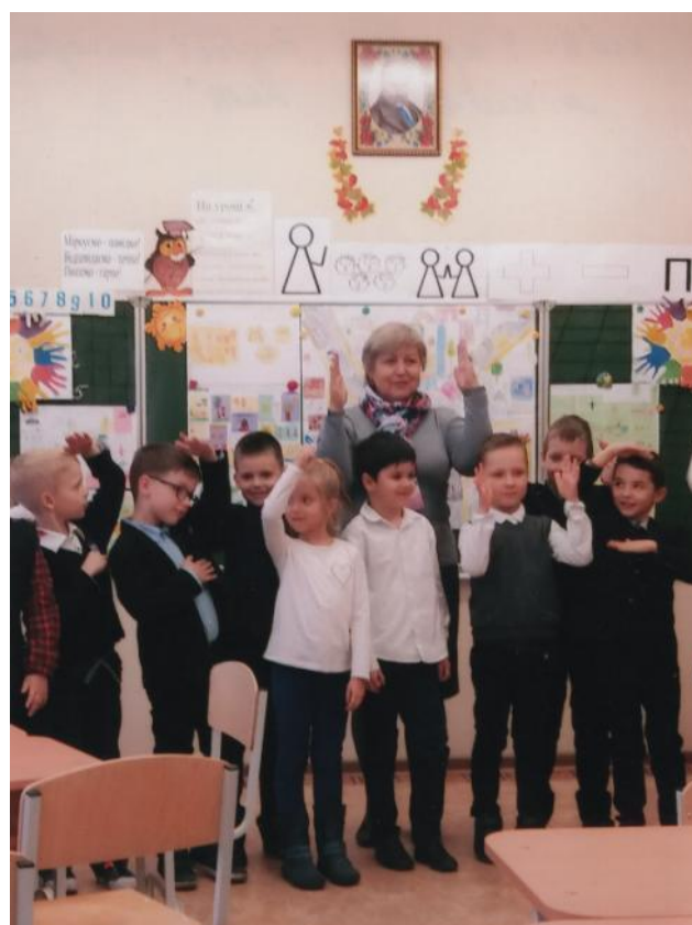
Діти у проєкті "Радість розвитку" (м. Київ 2018)