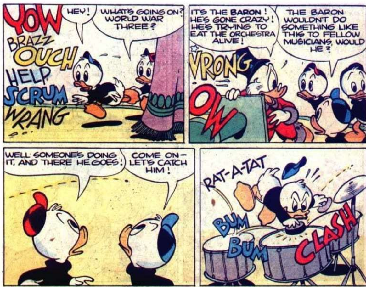
Рисунок 3.2.3. Приклад коміксу для розігрування історії на уроці англійської мови в молодших класах

Після попереднього ознайомлення вчитель роздає здобувачам освіти певні ролі. В рамках даного коміксу залучаються 4 здобувача освіти. Далі вчитель може попросити дітей прочитати діалоги своїх персонажів відповідно до тексту. Вони можуть використовувати жести та вираз обличчя, щоб підсилити виразність.