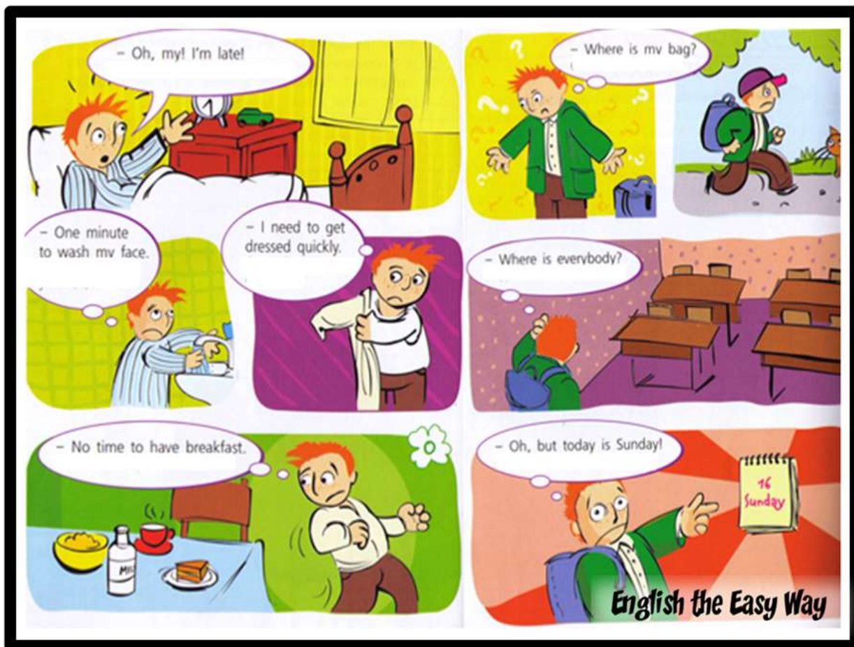
Рисунок 3.2.5. Приклад коміксу для творчого письма на уроці англійської мови в молодших класах

Далі він пропонує здобувачам освіти такі завдання: