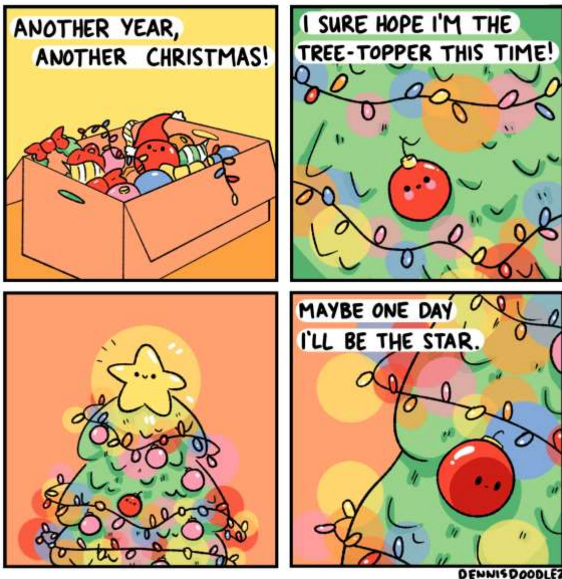
Рисунок 3.2.8. Приклад коміксу для дослідження культурного контексту на уроці англійської мови в молодших класах

Підготовляючи матеріал для даної справи, викладачу англійської мови слід обрати комікс із ярко вираженим культурним елементом, такими як: страви, одяг, символи або свята. Наприклад, розглянемо комікс про Різдво (Рис. 3.2.8):