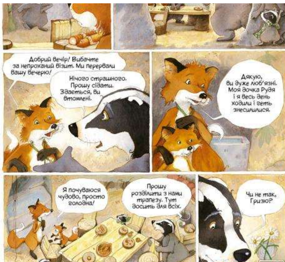
Рисунок 3.2.4. Приклад коміксу для перекладу і адаптації на уроці англійської мови в молодших класах

Для проведення даної вправи вчитель обирає короткий фрагмент коміксу, який він хоче, щоб учні переклали та адаптували на англійську мову. Наприклад (Рис. 3.2.4):