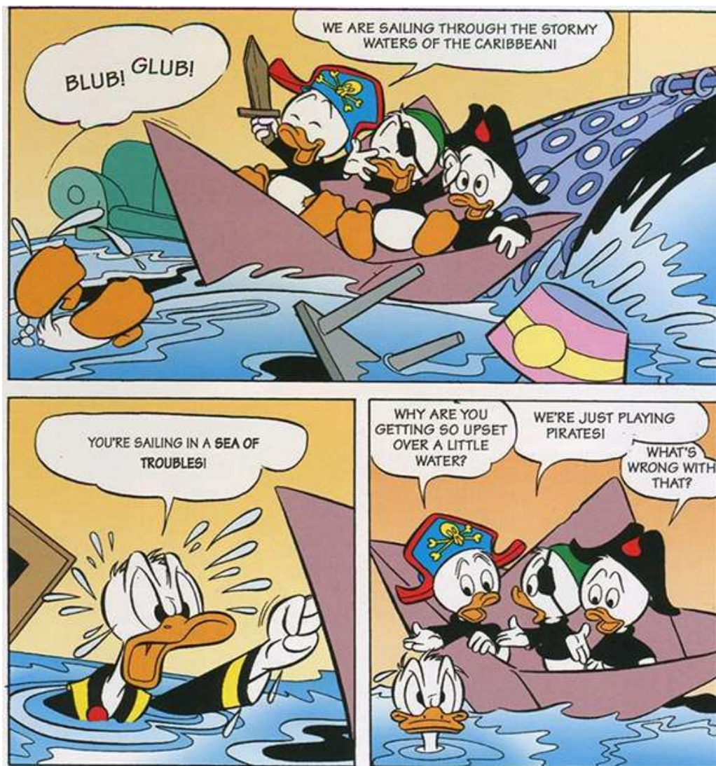
Рисунок 3.2.2. Приклад коміксу для прослуховування історії на уроці англійської мови в молодших класах

У такій праві вчитель пропонує дітям прослухати комікс, який він буде читати. Наприклад (рис. 3.2.2):