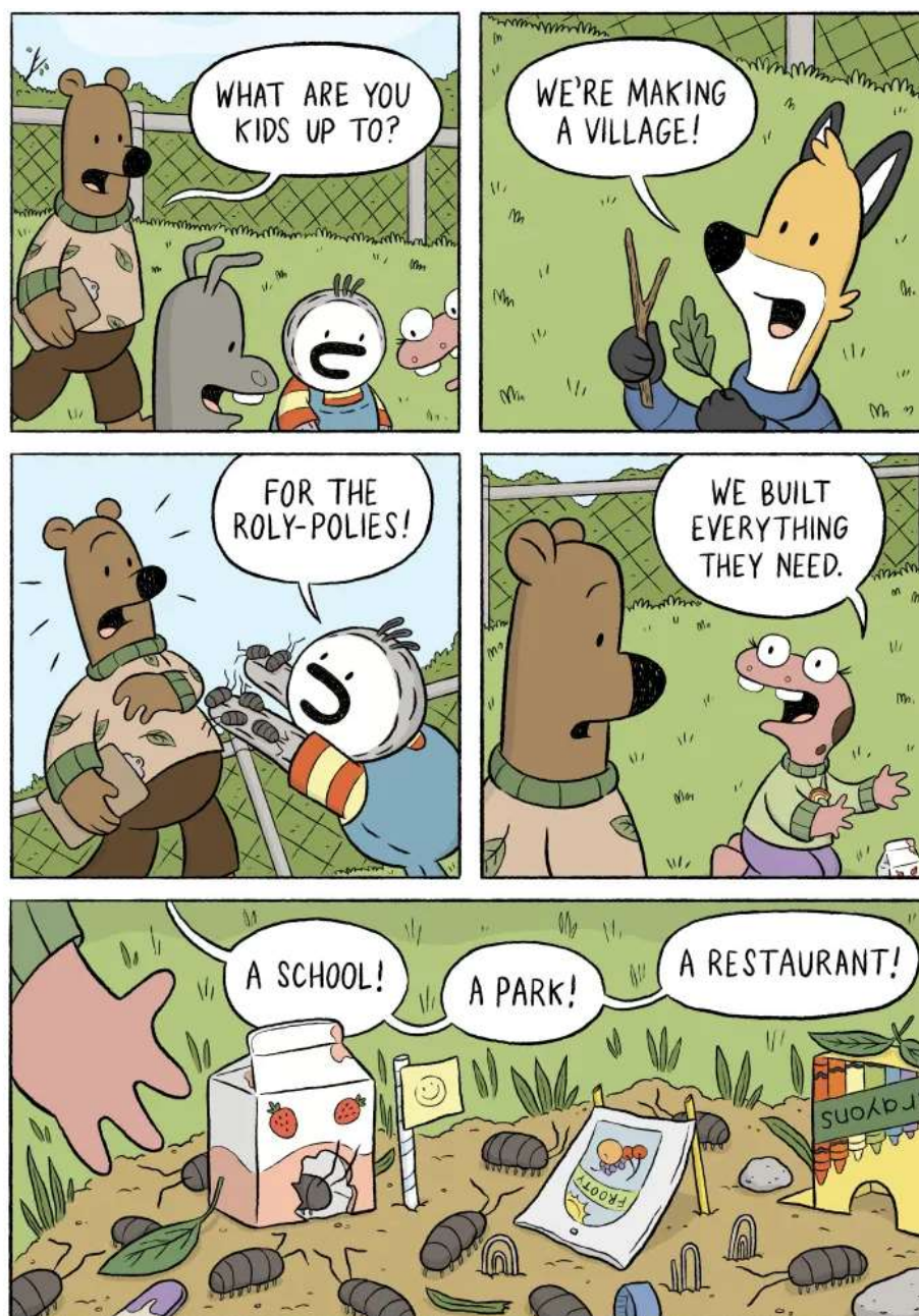
Рисунок 3.2.7. Приклад коміксу для граматичної вправи на уроці англійської мови в молодших класах

Ця вправа формує пізнавальний інтерес дітей, оскільки вона використовує візуальний контекст коміксу та активну практику граматики в літній тематиці, створюючи стимул для вивчення мови через практичні та цікаві завдання.