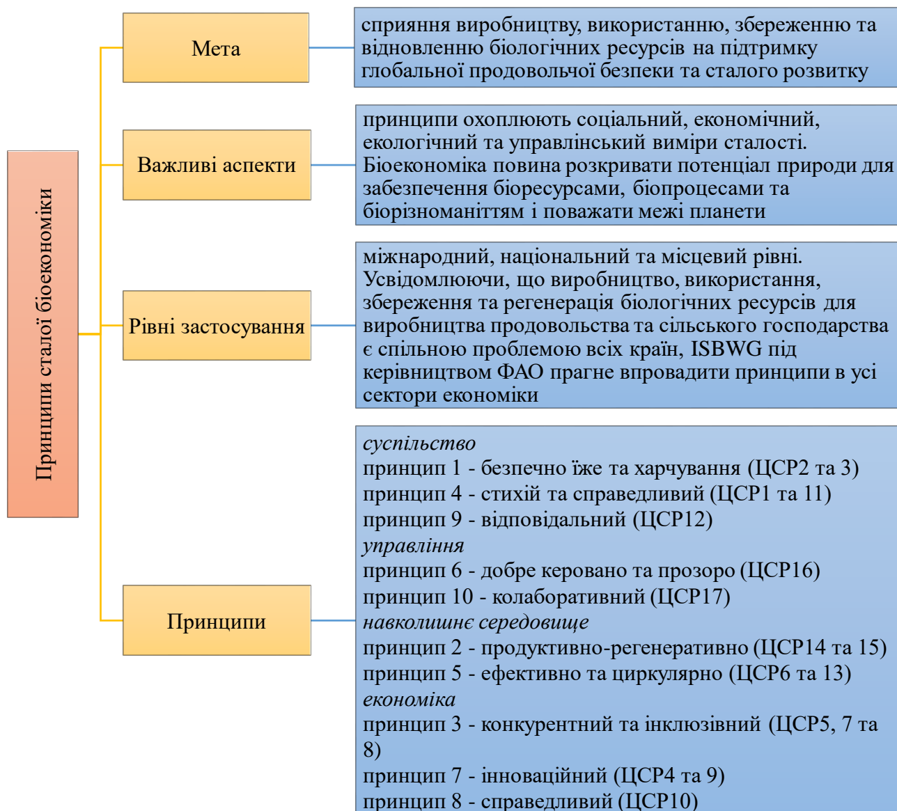
Рис. 2. Зміст принципів сталої біоекономіки