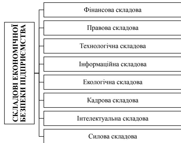
Рис. 1. Складові економічної безпеки підприємства

Функціональні складові економічної безпеки суб'єкта господарювання – це сукупність основних напрямів економічної безпеки, що істотно різні за змістом, характером виконуваних завдань, методом їхнього рішення і функціональними критеріями. Як і будь-яка інша система, система економічної безпеки підприємства має свої складові. В сучасній економічній науці немає єдиного підходу до структуризації цієї категорії. На нашу думку, найбільш вдалим є підхід О.С. Хринюка, який запропонував таку структуру функціональних складових економічної безпеки підприємства (рис. 1).