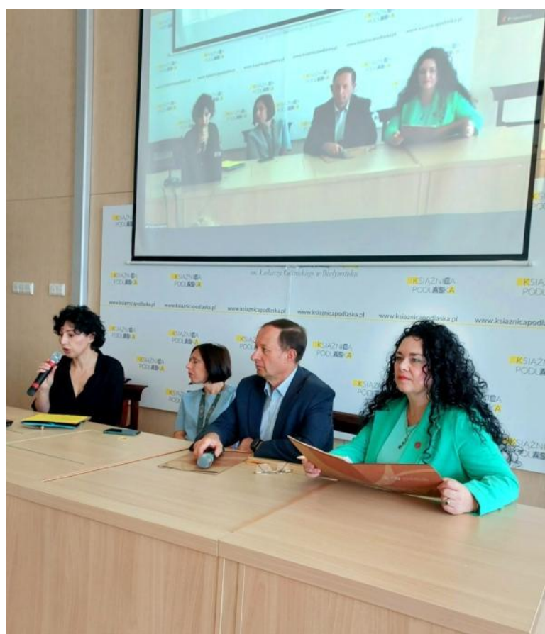
Виступ на міжнародній конференції в університеті Білостоку (РП), вересень 2022 р.