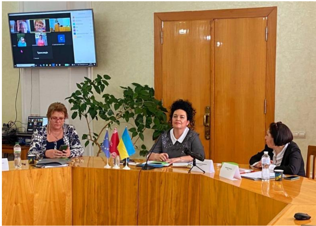
Засідання Спеціалізованої вченої ради Д 32.051.03, березень 2023 р. ВНУ ім. Лесі Українки