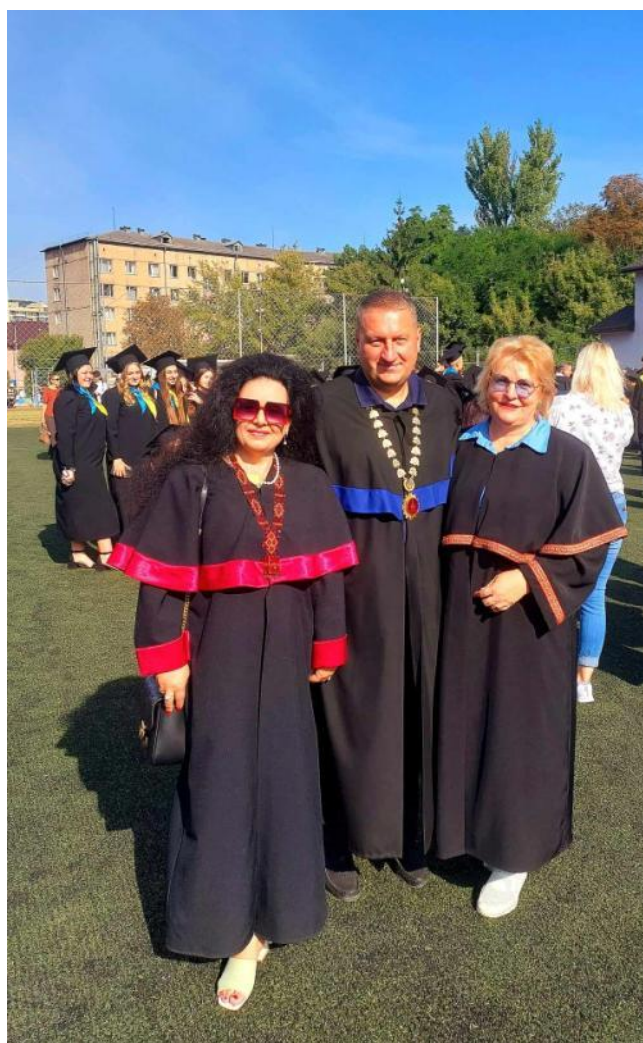
Інавгурація першокурсників, вересень 2023 р. ВНУ імені Лесі Українки