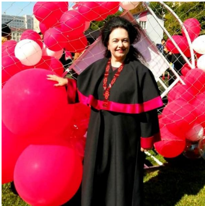
Інавгураційні урочистості в університеті, вересень 2020 р.