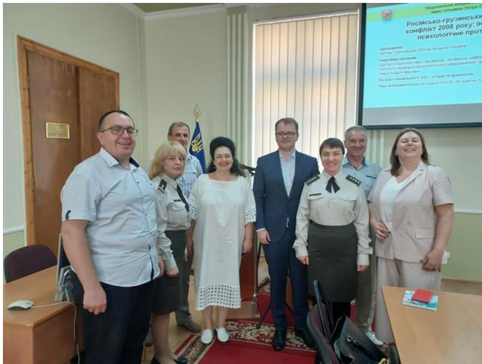
Опонування дисертації в Академії сухопутних військ імені гетьмана П. Сагайдачного. м. Львів, серпень 2022 р.