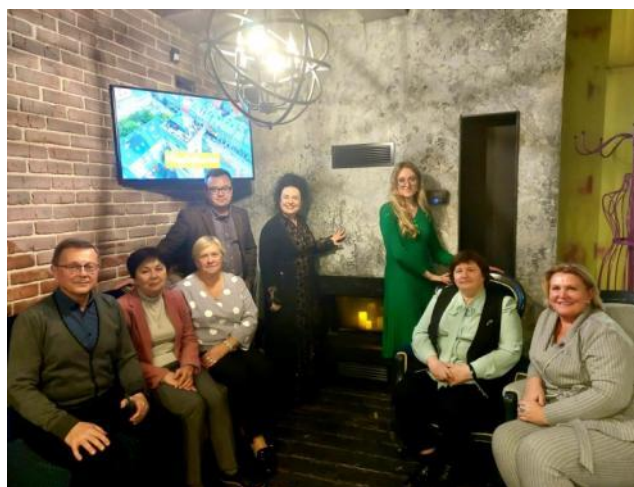
З колегами по кафедрі