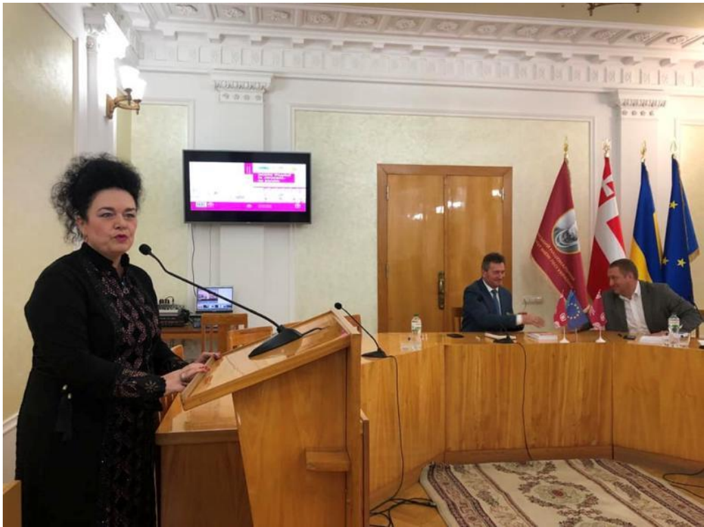
Під час презентації колективної монографії, Луцьк, жовтень 2022 р.