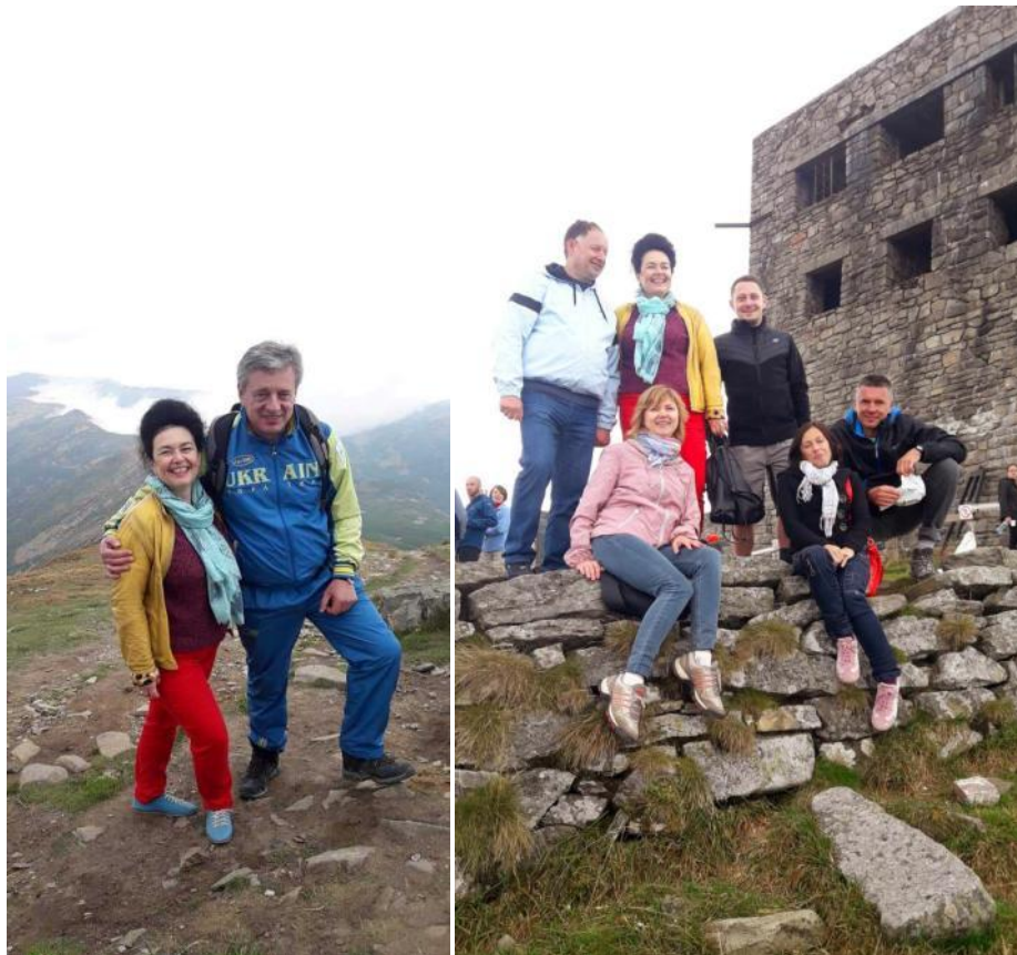
На вершині гори Піп Іван з учасниками українсько-польських зустрічей, вересень 2018 р.