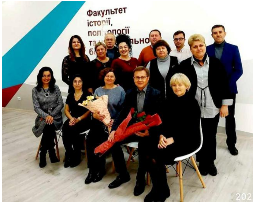
З колегами кафедри всесвітньої історії та філософії, листопад 2020 р.