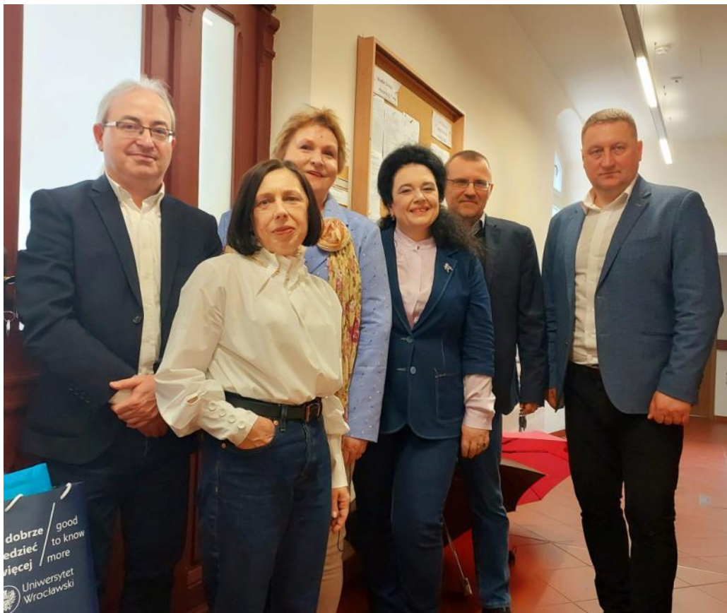
Під час стажування у Вроцлавському університеті (РП), березень 2023 р.