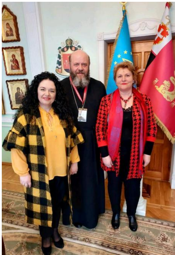
Робоча зустріч з Митрополитом Луцьким та Волинським Михаїлом, підготовка до спільної конференції, квітень 2023 р.