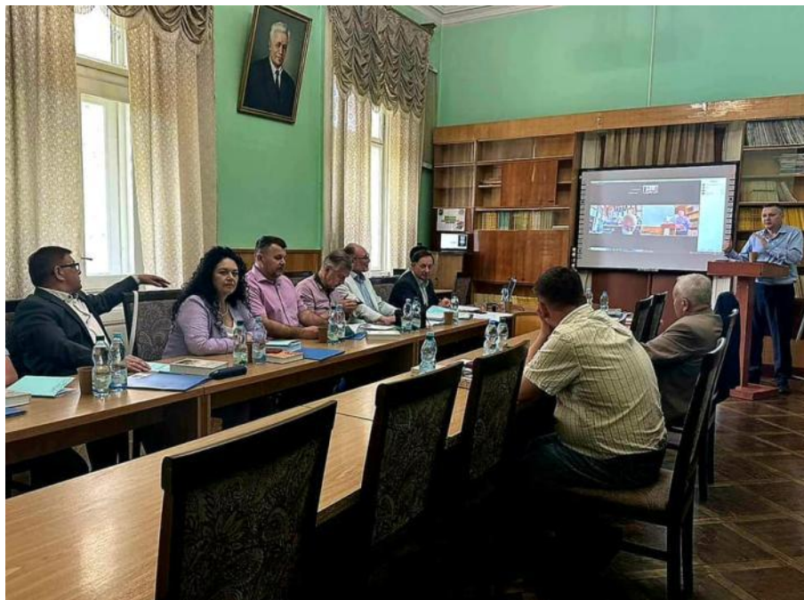
Засідання Спеціалізованої вченої ради у Чернівецькому національному університеті імені Юрія Федьковича. Чернівці, червень 2023 р.