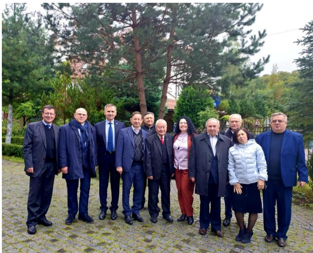
Міжнародна конференція у Яремче, жовтень 2022 р., з колегами