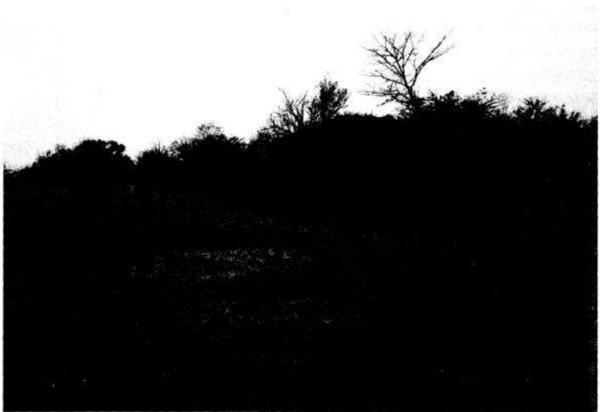
Фото 1. Рештки фортифікаційних споруд в с. Крупа.

Необхідно відмітити певні спостереження, які були зроблені у ході розвідок. Південний вал має незавершену форму – він тягнеться від земляної платформи №2 строго на захід на відстань біля 50 м, поступово знижуючись та звужуючись і закінчується плавним пониженням. До земляної платформи №3, з якою вал мав бути з'єднаний, не простежується жодних його ознак. Якби вал нівелювали у пізніший час, то, імовірно, це робилося б поетапно – певний його сегмент повністю зкопувався і вивозився. В даному випадку висота валу плавно знижується, що може свідчити про його незавершеність. Крім цього у південній напільній стороні не збереглось жодних слідів існування оборонного рову. Саме тому автор припускає, що земляні укріплення двору так і не були добудовані.