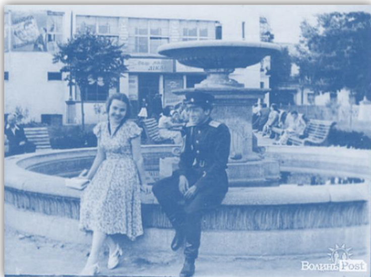
Лучани сидять на фонтані біля кінотеатру “Батьківщина” на зламі 1950–1960-х рр.