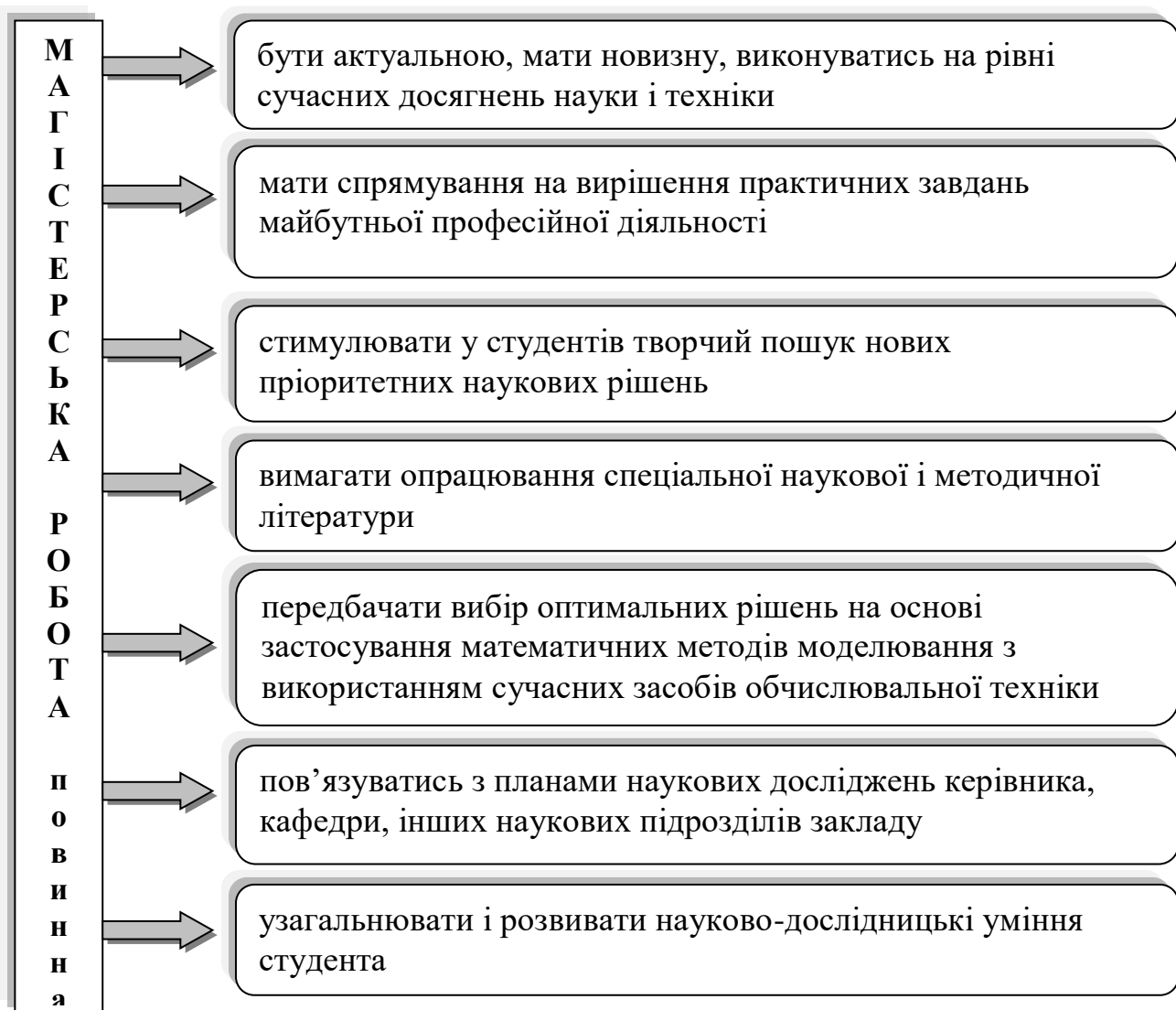
Рис. 1. Основні вимоги до магістерської роботи Виконання магістерської роботи має на меті:

Магістерська робота – самостійно виконана науково-дослідна робота студента, головною метою і змістом якої є наукові дослідження з новітніх питань теоретичного або прикладного характеру у сфері фізичної культури і спорту.