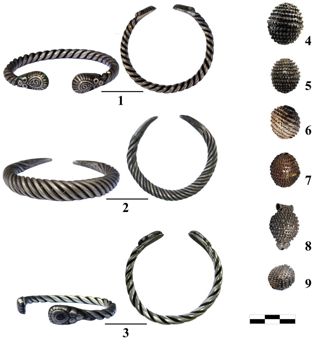
Рис. 1 (початок). Городищенський скарб 27 . 1-3 – браслети, 4-9 – намистини