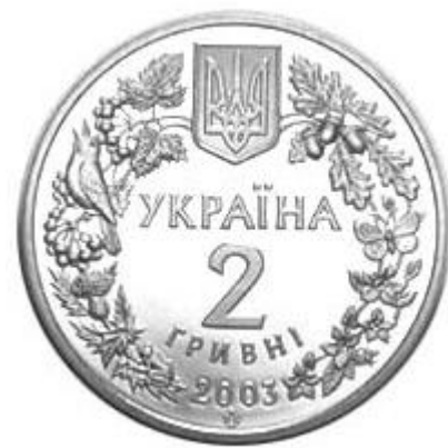
Рисунок 24. Морський коник (н) (НБУ (2023а))