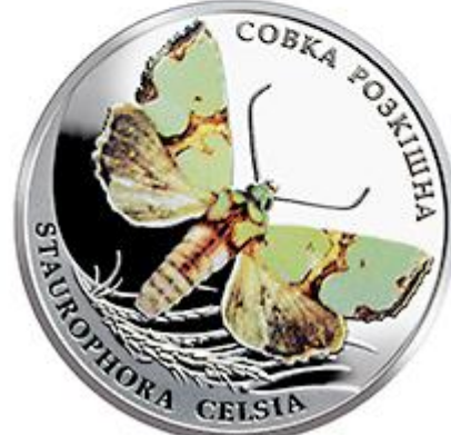
Рисунок 20. Совка розкішна (н) (НБУ (2023а))