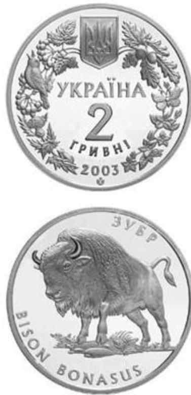
Рисунок 12. Зубр (н) (НБУ (2023а))