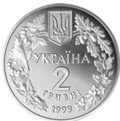
Рисунок 14. Соня садова (н) (НБУ (2023а))