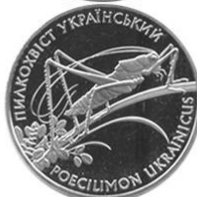
Рисунок 21. Пилкохвіст український (н) (НБУ (2023а))