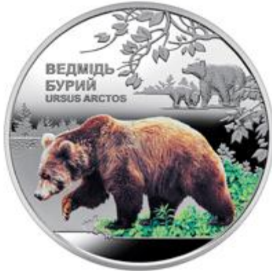
Рисунок 7. Чорнобиль. Відродження. Ведмідь бурий (н) (НБУ (2023a))