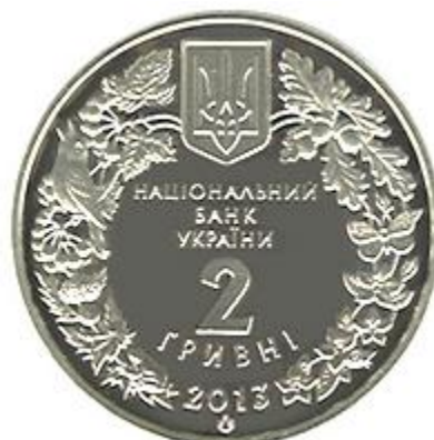
Рисунок 16. Дрохва (н) (НБУ (2023а))