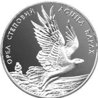
Рисунок 19. Орел степовий (н) (НБУ (2023а))