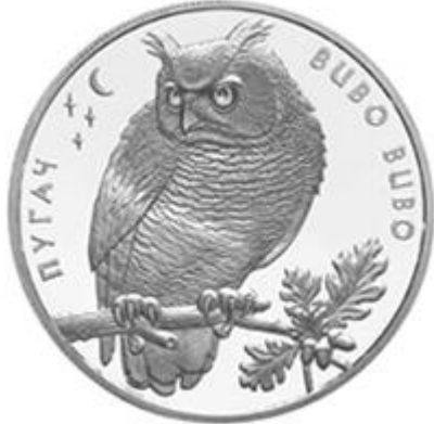
Рисунок 18. Пугач (н) (НБУ (2023а))