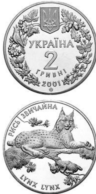
Рисунок 13. Рись звичайна (н) (НБУ (2023а))