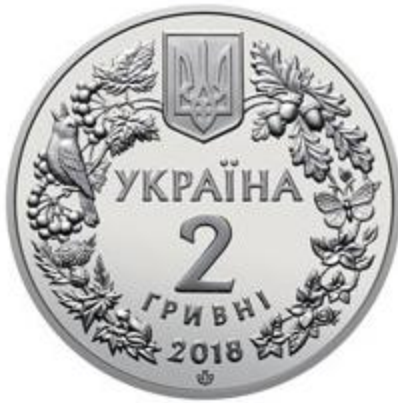
Рисунок 22. Марена дніпровська (н) (НБУ (2023а))