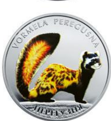
Рисунок 9. Перегузня (н) (НБУ (2023a))