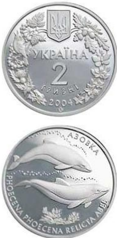
Рисунок 11. Азовка (н) (НБУ (2023а))