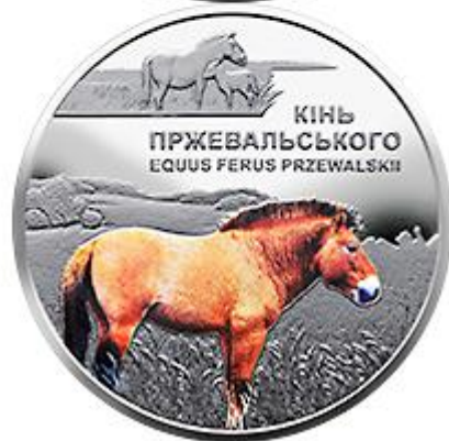
Рисунок 8. Чорнобиль. Відродження. Кінь Пржевальського (н) (НБУ (2023a))