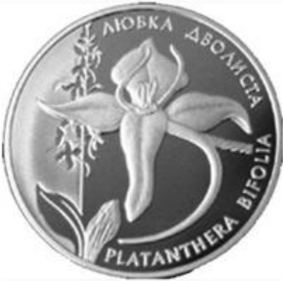
Рисунок 6. Любка дволиста (н) (НБУ (2023a))