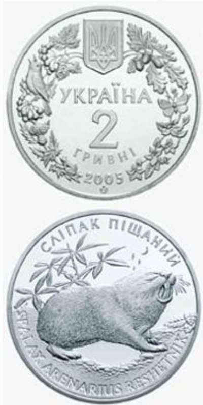
Рисунок 10. Сліпак піщаний (н) (НБУ (2023а))