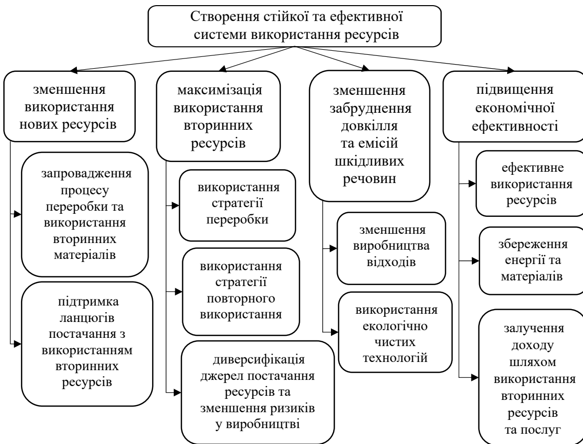
Рис. 3. «Дерево цілей» для циркулярних бізнес-моделей