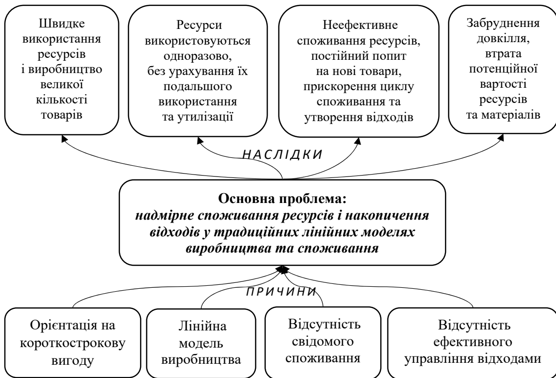
Рис. 2. «Дерево проблем» для циркулярних бізнес-моделей