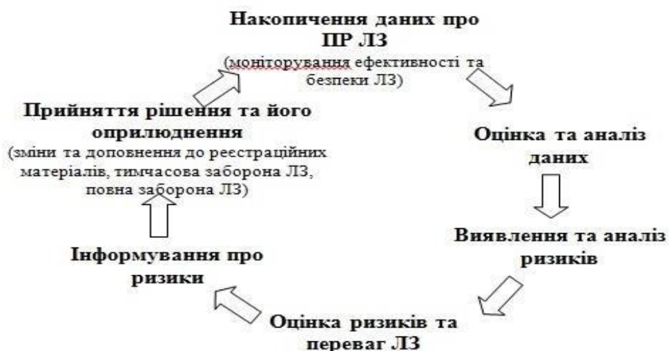
Рисунок 1. Цикл здійснення фармаконагляду

Україна офіційно взяла курс на євроінтеграцію у 1997 р. В рамках цього протягом останніх років нашою державою було проведено величезний обсяг роботи щодо гармонізації та імплементації європейських вимог щодо якості продукції і послуг, зокрема у національному фармацевтичному секторі. Одним з напрямків стала впровадження системи фармаконагляду. Здійснення фармаконагляду має циклічний та безперервний характер. Усе починається з виявлення випадку ПР ЛЗ, що найчастіше може статися у закладі охорони здоров'я (далі – ЗОЗ), включаючи аптечний заклад, або на дому, де відбувається лікування хворого. Після цього працівник з медичною або фармацевтичною освітою, пацієнт або його представник чи заявник повинен повідомити про цей випадок у відповідні терміни та у форматі, що встановлені законодавством країни. Інформація про випадки ПР ЛЗ надсилається у єдиному напрямку до установи, яка координує здійснення фармаконагляду в країні. Саме там відбувається накопичення такої інформації та її аналіз, включаючи виявлення ризиків, оцінку ризиків та переваг щодо застосування ЛЗ. Результати аналізу стають підґрунтям для прийняття відповідних регуляторних рішень, які повинні бути оприлюднені та доступні як медичній громадськості, так і пересічним громадянам (рис. 1).