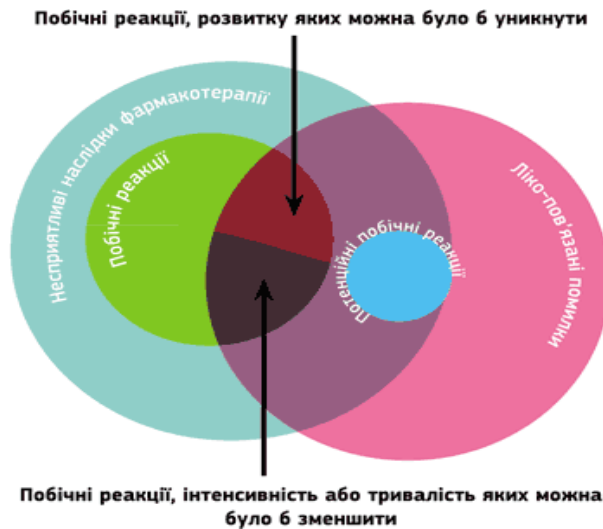
Рисунок 3. Взаємозв'язок між ліко-пов'язаними проблемами, побічними реакціями та медичною помилкою

зумовленими фармакодинамічними та фармакокінетичними властивостями молекули ЛЗ чи індивідуальною відповіддю організму на введення медикаментів. Отже, медичні помилки – явище, яке трапляється набагато частіше, ніж ПР, і тільки незначна їх кількість насправді є причиною розвитку ПР. Взаємозв'язок між ліко-пов'язаними проблемами, побічними реакціями та медичною помилкою представлено на рис. 3.