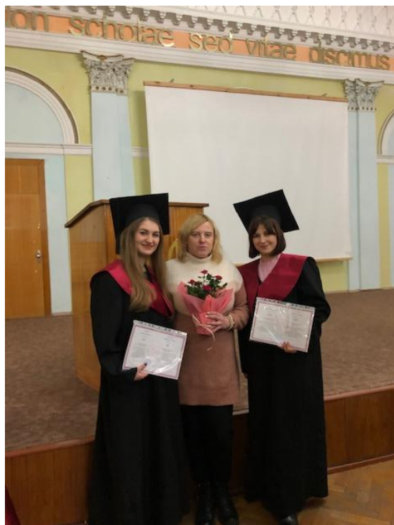
2022 рік, січень. З магістрантами факультету філології та журналістики.