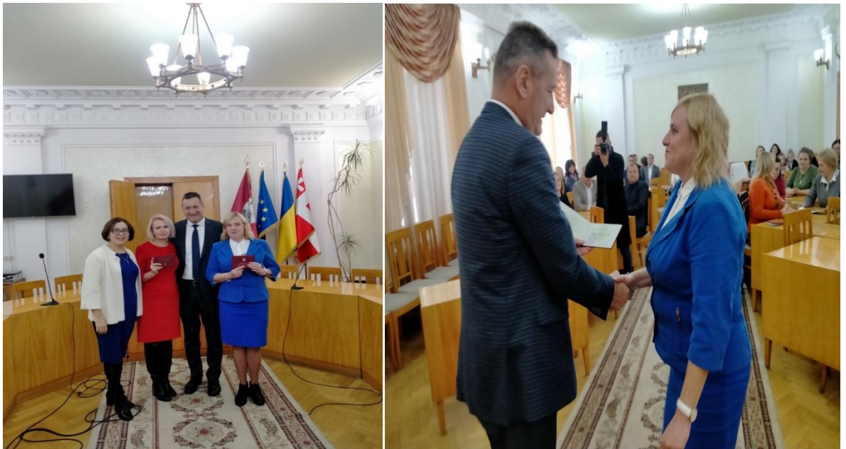
2021 рік, листопад. Вручення атестата професора на вченій раді ВНУ імені Лесі Українки.